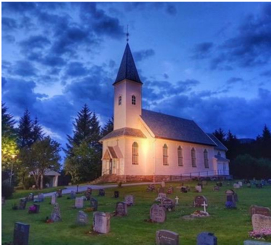
Mjømna kyrkje i kveldslys