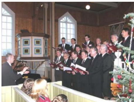
Frå ein tidlegare julekonsert i Brekke kyrkje.

Vi veit at det blir arbeidd med å få til lokale konsertar i dei ulike krinsane. Det er sett ein dato for konserten i Gulen kyrkje: søndag 19. desember kl. 16.00, men for dei andre kyrkjene har vi enno ikkje fått noko tidspunkt. Nærare kunngjering kjem etter kvart, så her er det berre å følgje med. Vi er veldig glade for at ting har normalisert seg, slik at vi igjen kan planlegge arrangement omtrent som før.