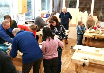
Arkivfoto frå 2019