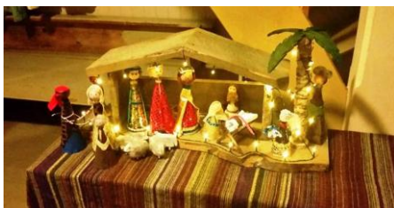
Arkivfoto av julekrubbe, Mjømna kyrkje

Neste nr. av kyrkjelydsbladet kjem før påske. Innleveringsfrist 20. februar. God jul til alle lesarane våre!