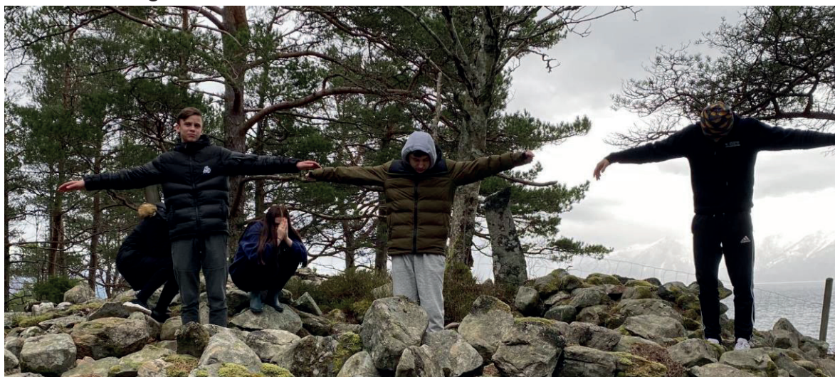
Krossfestinga på Golgata