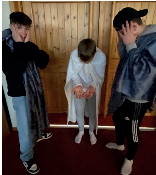
Jesus viser fram såra sine