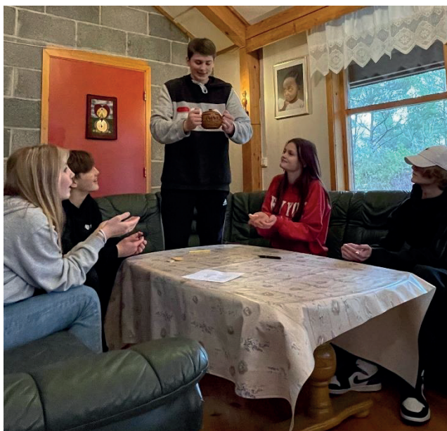
Innstiftinga av Nattverden