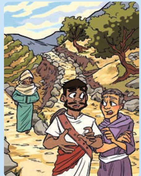
Teikning: Faye Simms

Her viser Jesus seg etter at han døde og stod opp att. Dei to bileta er nesten heilt like, men kan du finne fem feil på biletet under?