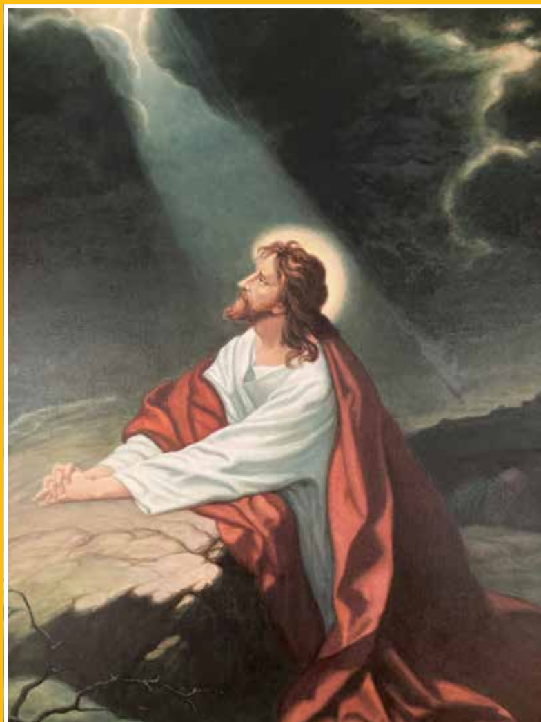
Altartavla i Vadheim bedehusapell. Foto: Andreas Ester