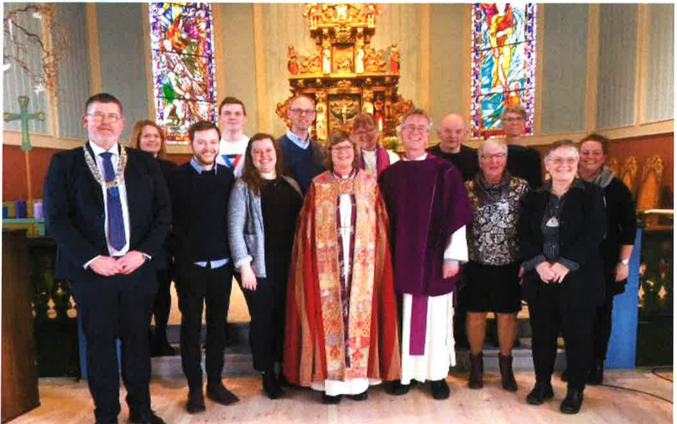
BISPEVISITAS FEBRUAR/MARS 2020: Kyrkja sitt viktige arbeid i lokalsamfunnet, krev samhandling og gode relasjonar både internt i DnK og til frivillige, lag og organisasjonar, politikarar og kommuneadministrasjonen.