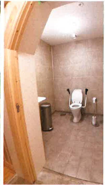
NYTT TOALETT: Endeleg fekk vi nytt toalett i kyrkja, universelt utforma.