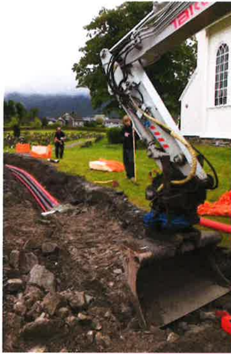
GRAVING: Rørlegging frå redskaps- hus til kyrkja, i høve det nye varme- systemet, samt fiber til kyrkja.