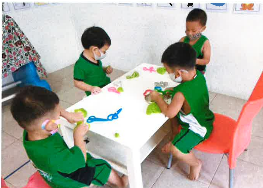
MISJONSPROSJEKTET: Frå prosjektet kyrkjelyden støttar i Thailand. Barn på dagheimen "Lousangshjemmet".

Hareid kyrkjelyd har avtale med Det Norske Misjonsselskap (NMS) om kyrkjelyden sitt misjonsprosjekt i Thailand. Misjonsutvalet arbeider med å gje informasjon til kyrkjelyden om misjon generelt og om misjonsprosjektet spesielt, og med å samle inn pengar til misjonsprosjektet.