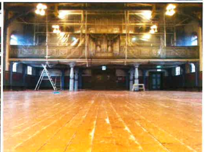
NYTT GOLV: Renoveringa av kyrkja blei iverksatt sommaren 2019 og har pågått også i heile 2020. Framleis gjenstår det enno litt. Bilda over ser vi før og etter nytt golv i kyrkjerommet.