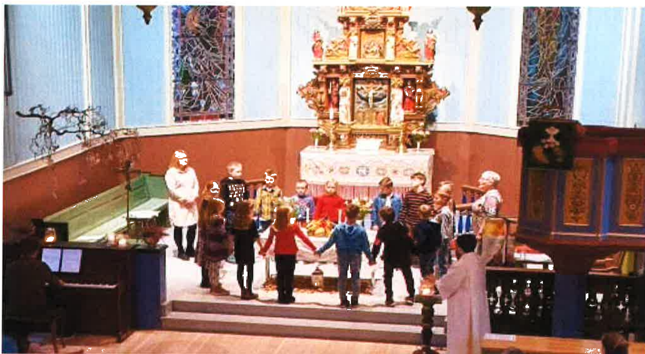
TRUSOPLLÆRINGA: Barna som er med i trusopplæringa deltek også aktivt i gudstenestene.