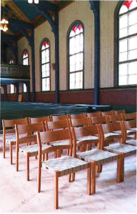
NYE STOLAR: 30 nye stolar framme i kyrkja gir meir fleksibilitet for dei ulike aktivitetane i kyrkja. Same stolar som i Nordstrand kyrkje.