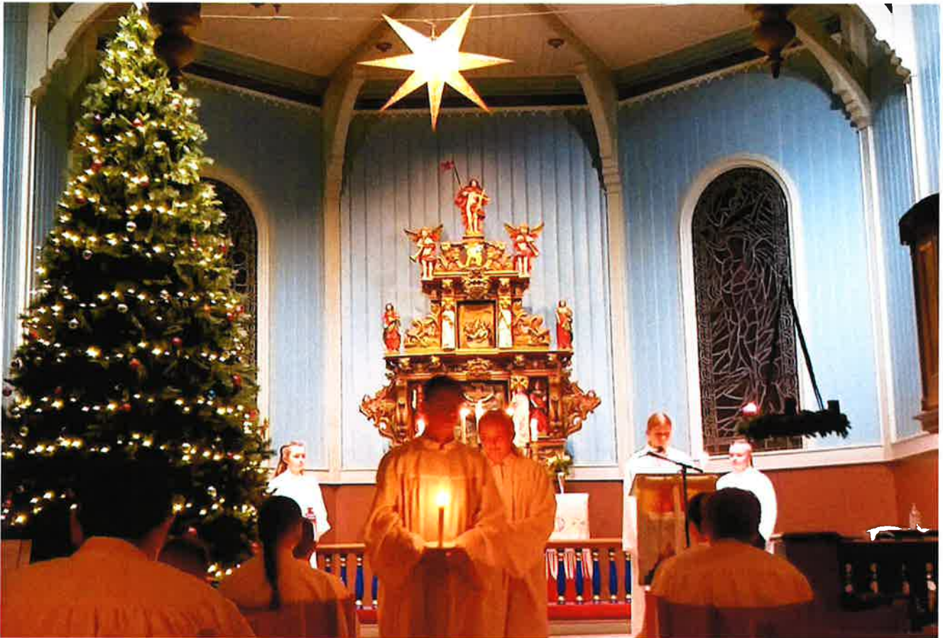
LYSMESSE: Den tradisjonelle lysmessa for konfirmantane blei gjennomført også i år, der vi kørte 3 lysmesser tilpassa restriksjonane. Ei fin og verdig markering for dei komande konfirmantane.