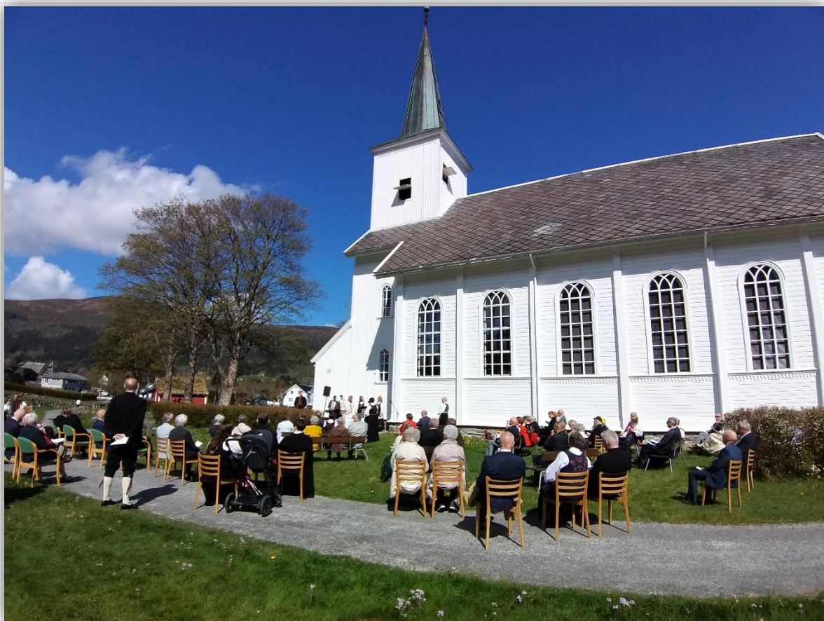
MEIR HIMMEL PÅ JORDA: 17. mai vart gudstenesta utandørs i fineveret. Dett gjorde at fleire kunne ta del enn innandørs, grunna smittevernrestriksjonar.