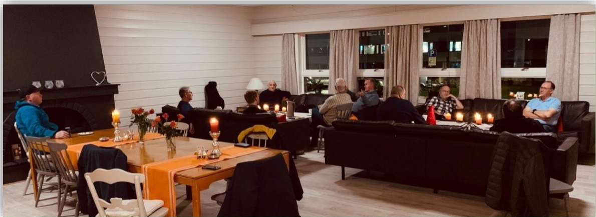
KARAKVELD PÅ KYRKJELYDSHUSET: Sosialt og åpent treffpunkt for karene, et nytt tilbud som oppsto ved renovering av aktivitetsrommet til frivilligsentralen.

Tilskuddet til Frivilligsentralen har også i år gått inn i det ordinære rammetilskuddet til kommunen og overføres til den som driver sentralen (her Hareid Sokn) Fra 2022, kommer tilskuddet til kommunen som øremerkede midler, og skal overføres i sin helhet til sentralene. Antall frivillige som er knyttet til sentralen ligger nå på ca 90 personer- men som en vil se ut fra årsmeldingen, har ikke alle fått være så aktive som en har ønsket. Vi holder kontakten med alle, og håper vi snart er i vanlig gjenge.