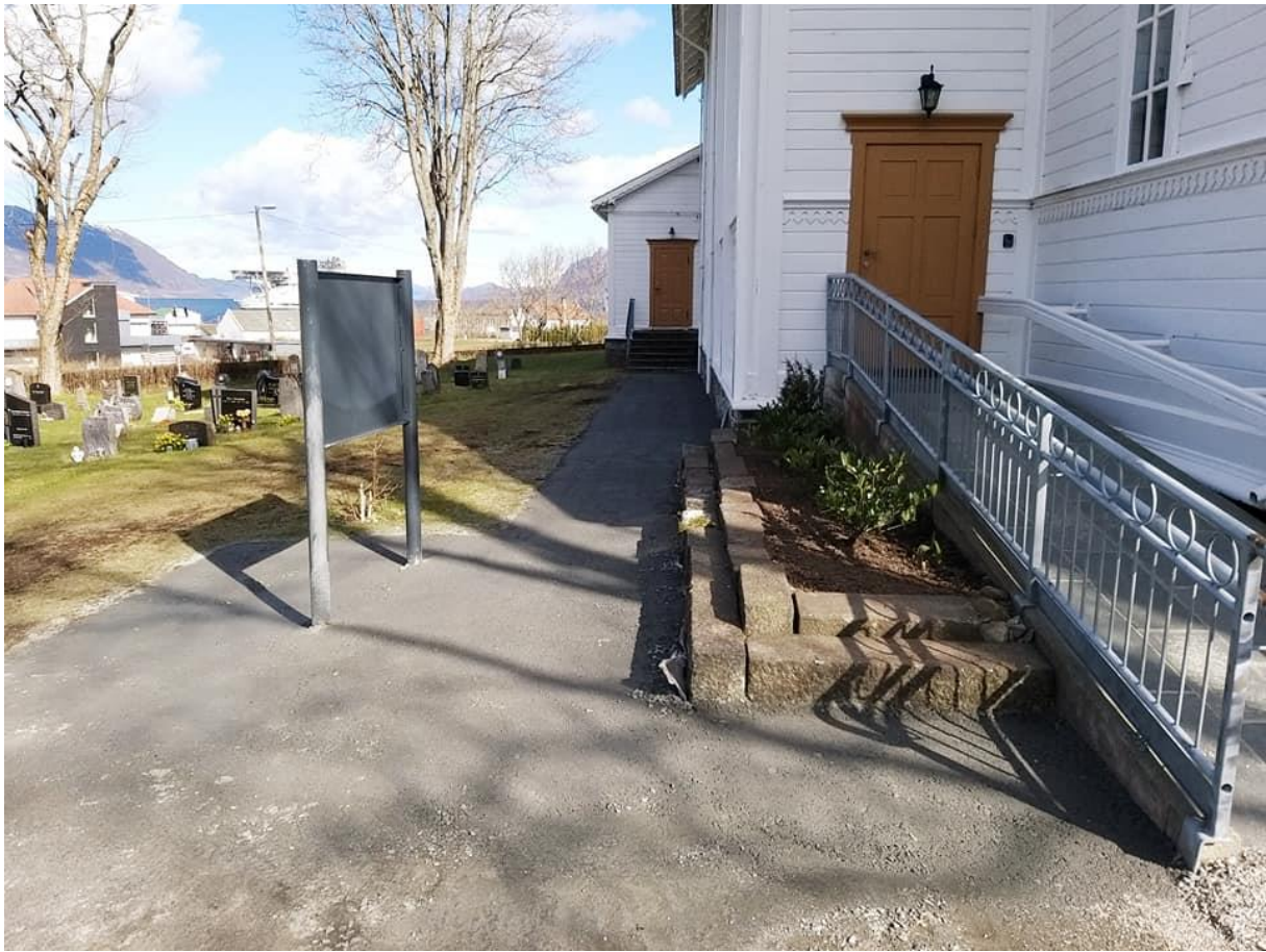
DUGNAD PÅ KYRKJEGARDEN: Det store prosjektet i 2021, var å lage til ein skikkeleg vei til dåpssakristiet. Det blei lagt ned duk, grov pukk og eit topplag med grus. Flott resultat.