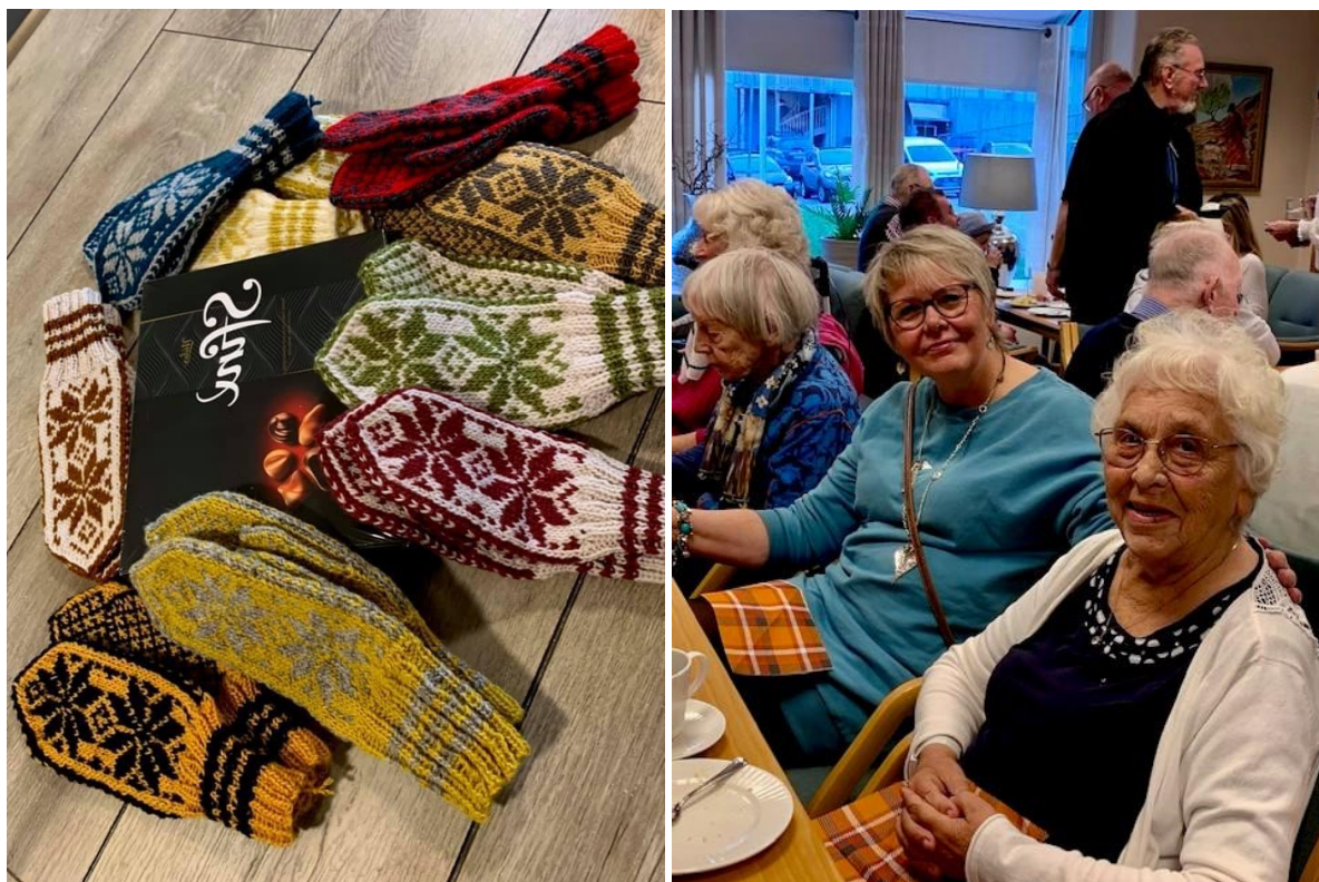
Diakoniutvalet har hovudansvar for diakoniplanen. Mange tiltak i planen har Frivilligsentralen eller andre ansvar for å gjennomføre.

Frivilligsentralen og dagleg leiar er sentral i det diakonale arbeidet i soknet. Meir om diakoniarbeidet er å lese i Frivilligsentralen si årsmelding.