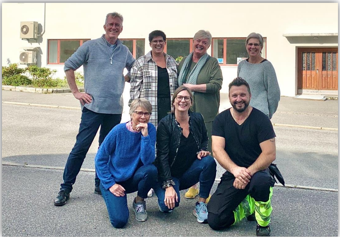
STABEN I HAREID SOKN: