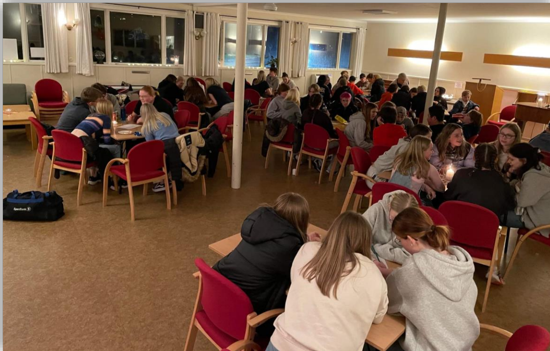
NATTKAFÈ ALLEHELGEN: Populært tilbod der mange ungdomar samla seg til sosialt fellesskap. Ansvarleg arrangør med vaksne tilstades var diakoniutvalet.