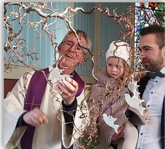
Generasjonsmøte kan ha mange slags former. Her hengast det opp ei dåpsdue i kyrkjegreina, etter at ei barn er døypt.