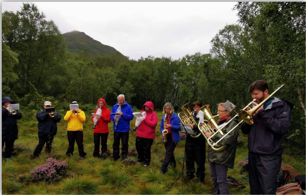
I GUDS SKAPARVERK: Ei gruppe frå Musikklaget Melshorn spelte på utandørsgudstenesta på Alskleiva, ein av mange aktørar som bidreg med musikk gjennom året.

band som var villige til å bruke så mange timar på det som vart to flotte konsertar, derav den siste som vart streama på Facebook.