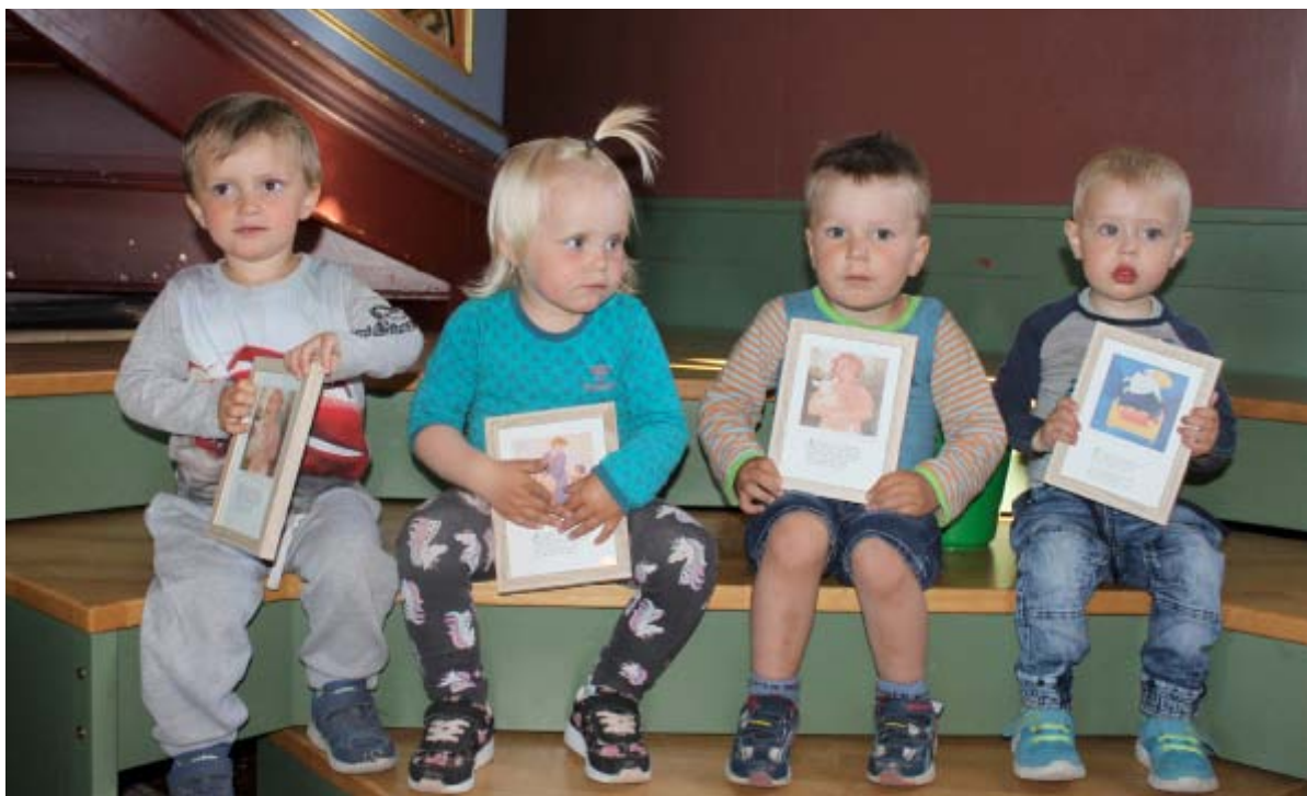
2-åringar på dåpsmarkering får seg bilde med kveldsbøn på