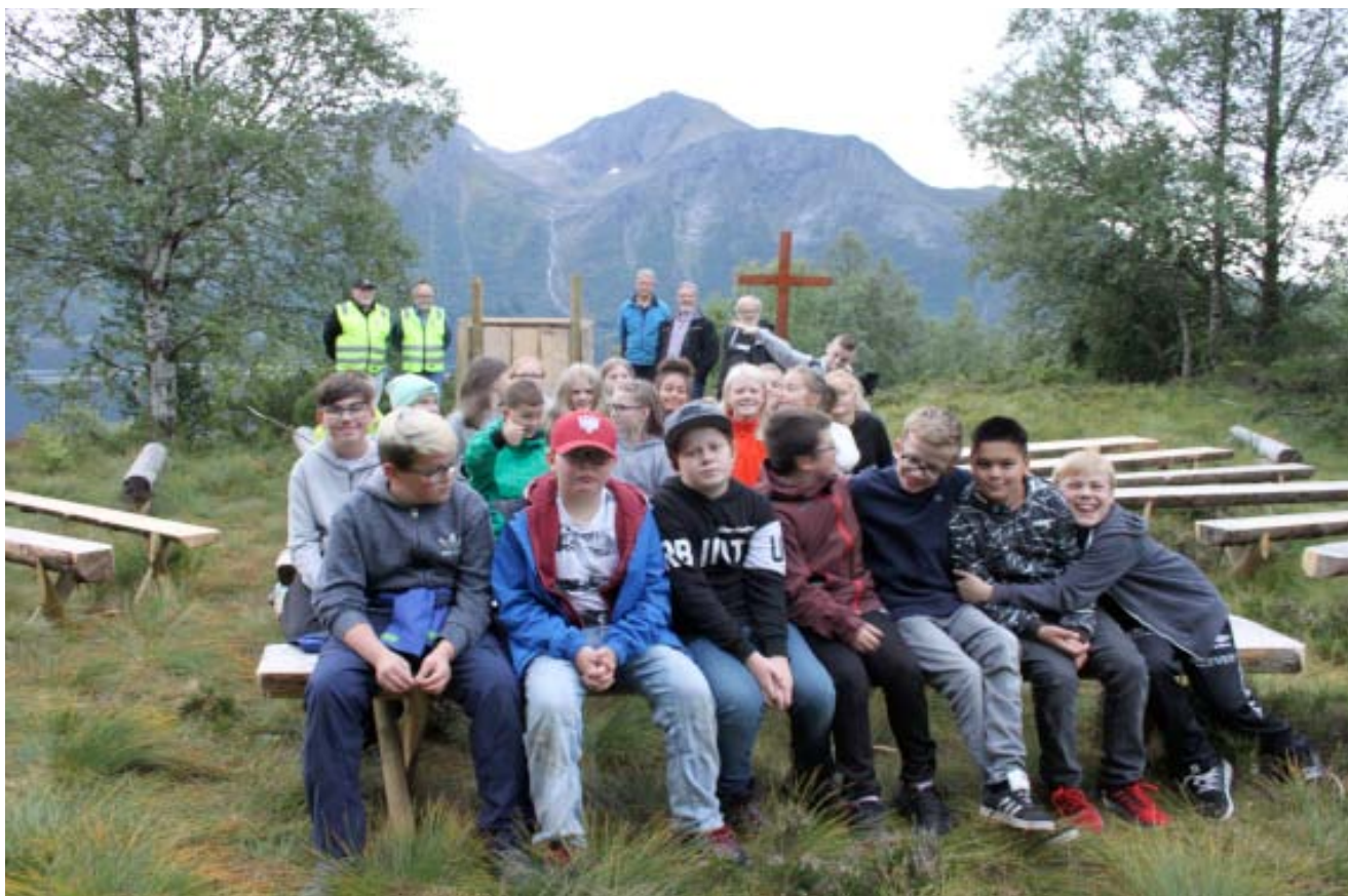
Lionskarane på Alskleiva saman med juniorkonfirmantane inspiserer Alskleiva torsdagen før gudstenesta.

Etter gudstenesta på Alskleiva i 2017 kom nokre i snakk om at det hadde vore kjekt med fleire benkar å site på. Det er heilt greitt å site i lyngen, men på dagar med regn og væte er ikkje det så kjekt. Det brukar som regel å vere mykje folk samla til denne gudstenesta, både 7 og 12 åringane i trusopplæringa har oppgåver i og kring denne gudstenesta. Karane i Lions tok utfordringa og har laga mange nye siteplassar på gudstenesteplassen. Dei har også laga nytt kors og talarstol. Det er mykje godt som kan skje når fleire gode krefter går saman!