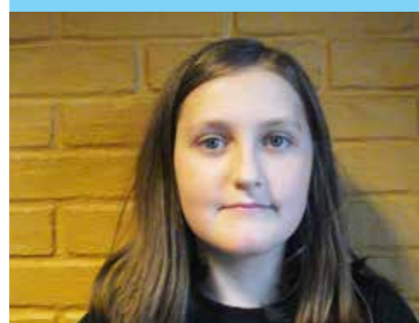
THEA 12 ÅR

-Alle barn skulle få gått på gratis skole.