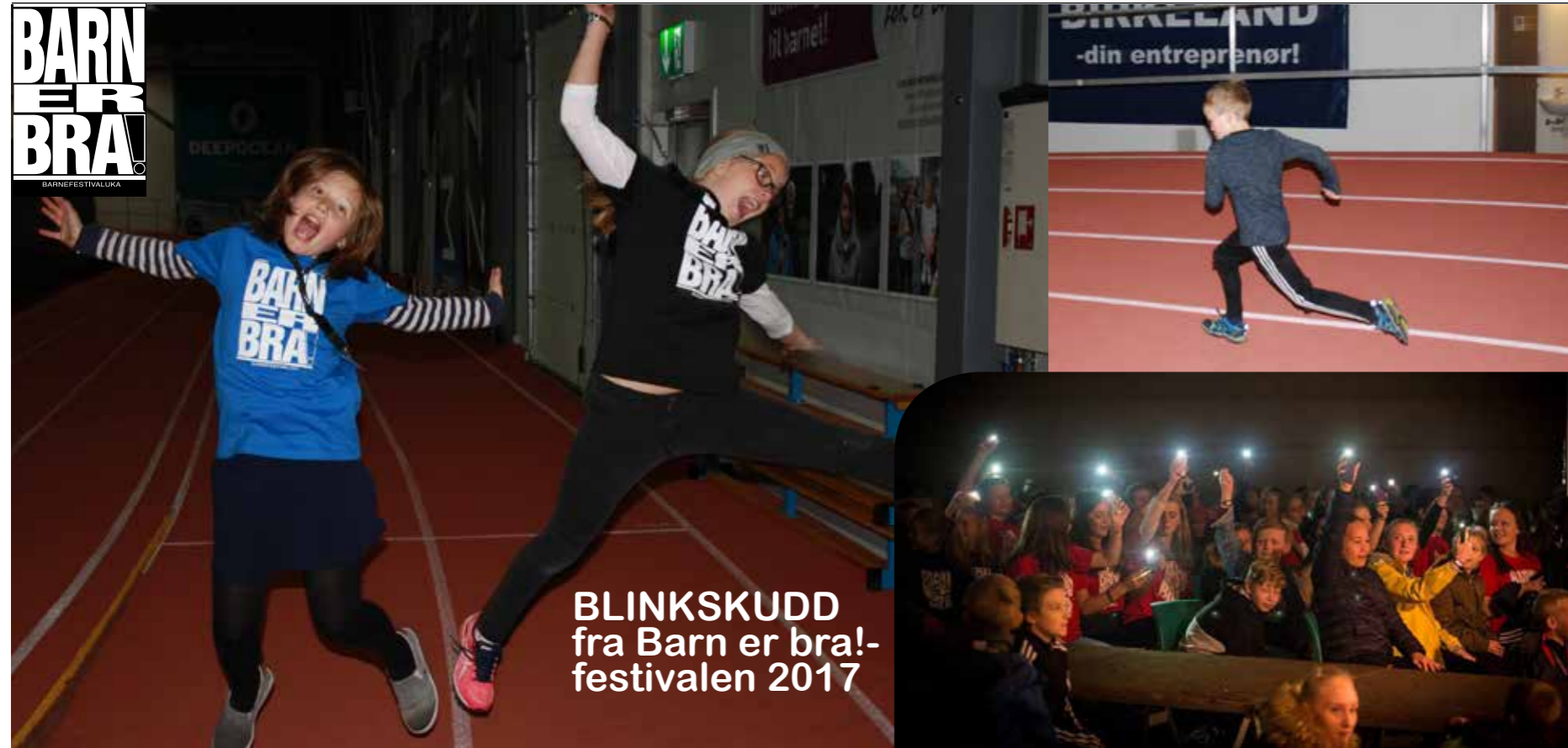
BLINKSKUDD fra Barn er bra! festivalen 2017