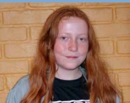
AMIE 11 ÅR

-Jeg også ville fått slutt på all krigen i verden.