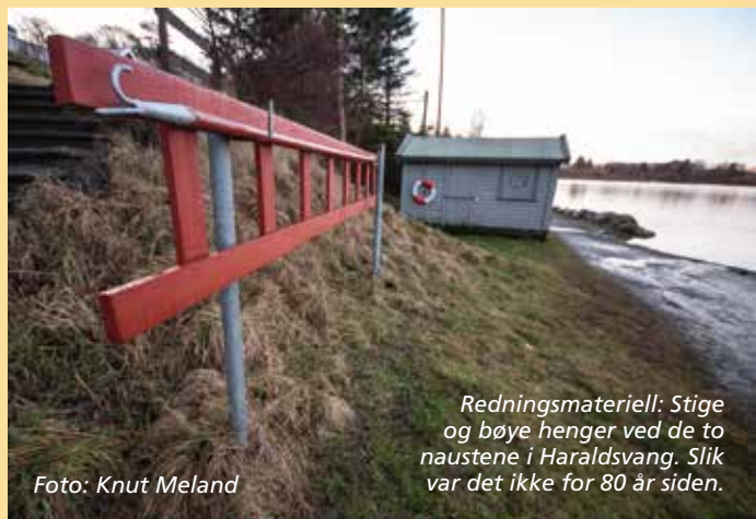
Redningsmateriell: Stige og bøye henger ved de to naustene i Haraldsvang. Slik var det ikke for 80 år siden.

- Nei, den båten er nok ikke mer. Men det ligger en båt der. Og den kan jo være god å ha, både sommer og vinter.