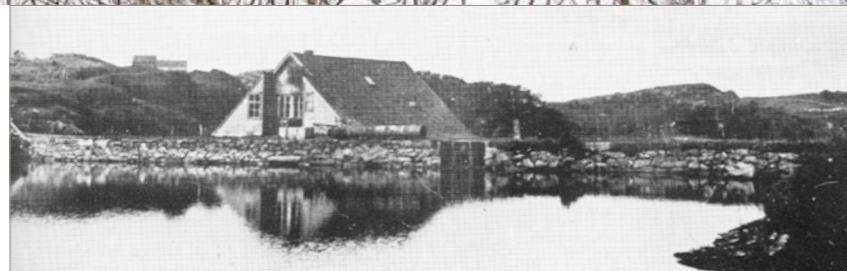
I MØLLEDAMMEN LIGGER EN ROBÅT, OG ELVEGÅRD MØLLE ER FREMDELES EI MØLLE. FRA BOKA «DET GAMLE HAUGESUND»