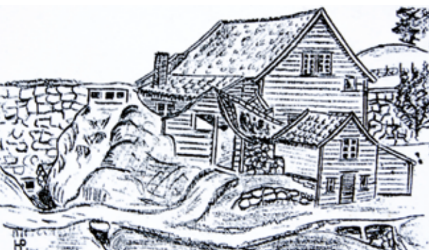
MØLLA SETT NORDFRA I HENNING PAULSENS STREK. FRA HAUGESUNDS AVIS 18. JUNI 1918