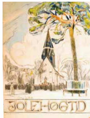
«Julehøgtid» var et forseggjort, litterært julehefte.

I mellomkrigstiden fikk juleheftene sin andre gullalder. Nå var det tegneserieheftene som dominerte. Etter trange kår med papirmangel i krigsårene tok salget seg opp etter krigen. Så kom fjernsynet, og dermed ble det flere utenlandske og færre norske hefter.