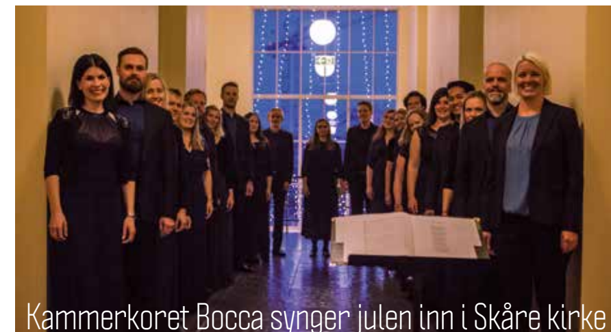
Kammerkoret Bocca synger julen inn i Skåre kirke

Vår Frelser's kirke, søndag 22. desember kl. 11.00. FELLESSLAMING FOR ALLE BYENS MENIGHETER