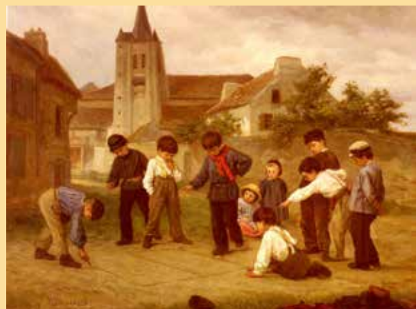
På 1800-tallet: Franske gutter gjør klart for paradishopping. Malt av den selvlærte maleren Theophile Emmanuel Duverger en gang på slutten av hundreåret.

Hvor man hoppet det aller første paradis, er uvisst. Kanskje var det allerede i antikkens Roma. Der har arkeologene funnet paradistegninger risset i stein. Romerne var veinbyggere og bygde et veinett som strakte seg fra Lilleasia til Nord-Europa. Muligheten til å risse paradisspill på steinlagte romerske veier kan ha bidratt til utbredelsen av spillet. Om spillet har eksistert i enda tidligere tider kan vi vanskelig si noe om. Selv med moderne metoder er det vanskelig for arkeologene å finne rester av paradiser tegnet med en pinne på et stykke flat og hard jord.