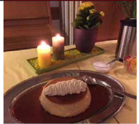
På menyen sto lammelår med fløtegratinerte poteter og hjemmelaget karamellpudding til dessert.