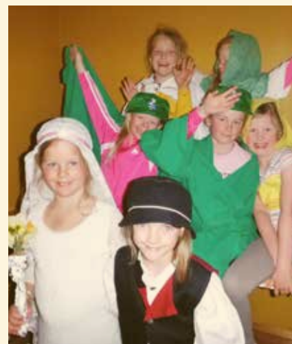
Amigos-gjengen dramatiserer gjerne bibelfortellinger, her er det bryllupsfesten i Kana som blir spilt ut på Brakahaug.