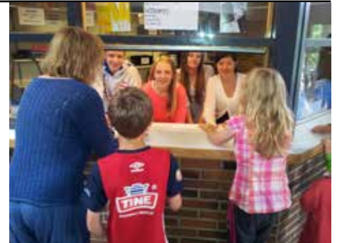
Kiosken er et høydepunkt for mange i løpet av leiruka.