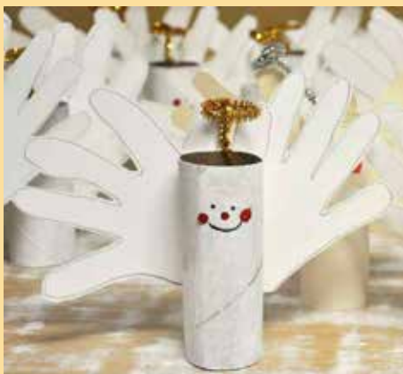
Juniorengel: Lengst nede i kassen var barnehageenglene med kropp av dorullkjerne.

Olemann syntes ikke det var lett å få sove. Det kriblet i magen, og julekvelden var veldig lenge til, selv om det var i overmorgen. Han prøvde å telle til hundre. Han kom omtrent til femtisi. Da sovnet han.