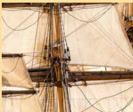
Riggen: Tauverk, seilduk, master og rær. Her ser vi store røylseil. Det nest øverste på stormasta.