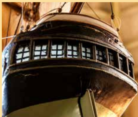
Innredet: Kapteinens kahytt er innredet med blant annet en fastmontert kikkert på hver side. Og gjennom kahytten går rorstammen.