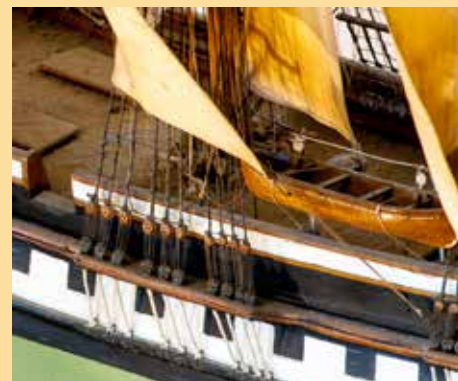
Blokker. Vantene er festet i røstjern og strammes med jomfruer (blokker med tre hull).