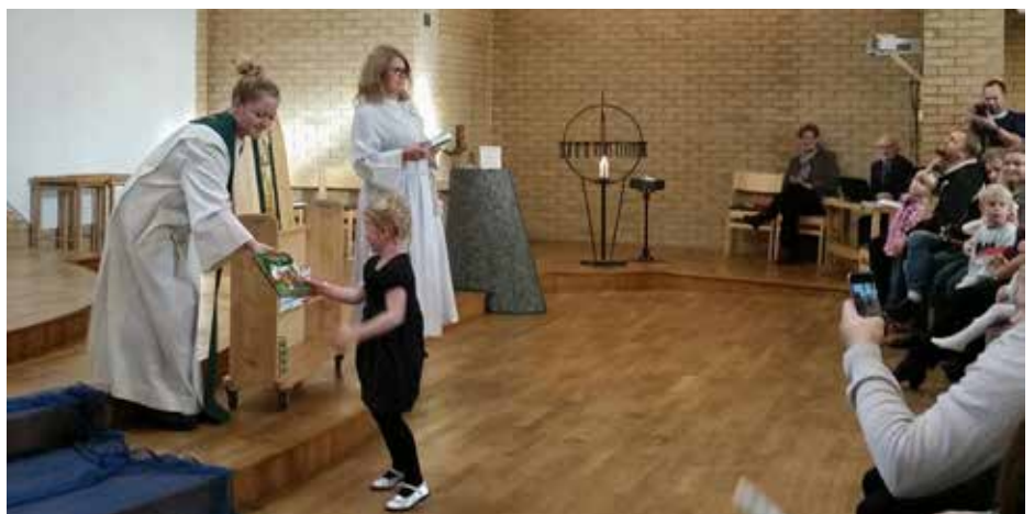
Hele 72 prosent av fireåringene i Skåre menighet kom for å ta imot barnebibelen i Udland kirke i 2015.

Innen påske er årsmeldingen for Den norske kirke klar. Da vil tall og analyser være tilgjengelige på www.kirken.no/haugesund