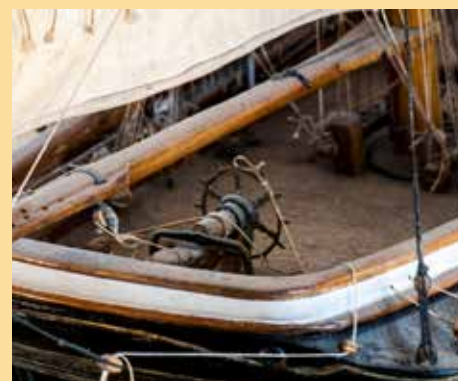
Rattet. Her var rormannens værharde plass. Rett over kapteinens kahytt.