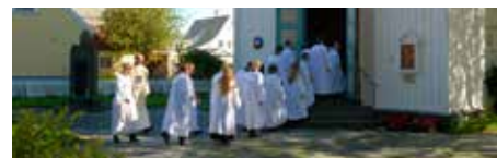
Konfirmasjonene starter i slutten av august, de første skjer i Skåre menighet. Så følger Rossabø i midten av september og Vår Frelzers i slutten av september.

Formiddagsandakt hver fredag kl. 11.00 i Vår Frelzers kirke. «Åpent hus» i menighetshuset etterpå.