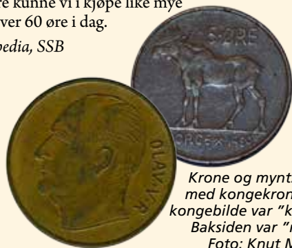
Krone og mynt. Siden med kongekrone eller kongebilde var "krone". Baksiden var "mynt".