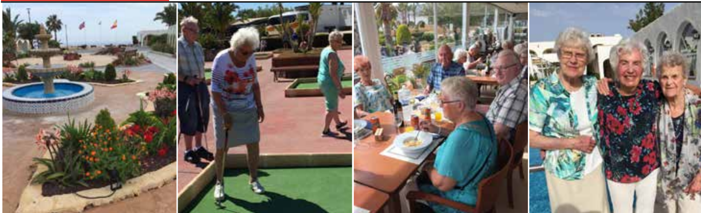
Sol, varme og vakre omgivelser fikk eldre fra Haugesund til å blomstre om kapp med rosene på Solgården.