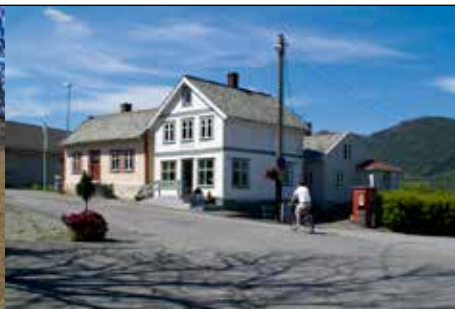
Vår nærmeste: Kiosken på kaien i Ølen.