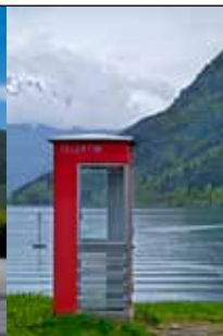
Vernet: Kiosken på ferjekaien i Kinsarvik