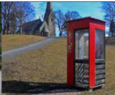
Bryllupskiosken: Her, ved Vålerenga kirke, var det en vielse i 2003.