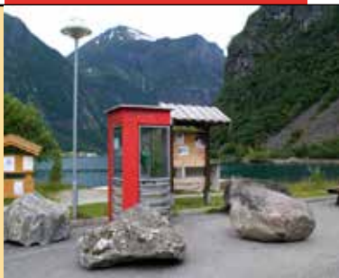
Ble lenket fast: Telefonkiosken på Bjørke i Ørsta.