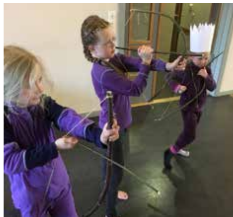
På Plan B i Skåre menighet får barna mange ulike utfordringer. Planleggingsdag på skolen er en god mulighet for menigheten til å invitere til trosopplæring.

Totalbesøket på alle gudstjenester i Haugesund var høyere i 2017 enn 2016, med en oppgang på over 1.300 besøk, tross færre gudstjenester. Snittet pr. gudstjeneste stiger dermed tydelig. Nattverdsdeltakelse hadde nedgang, men ligger fortsatt over snittet for de siste 10 år.