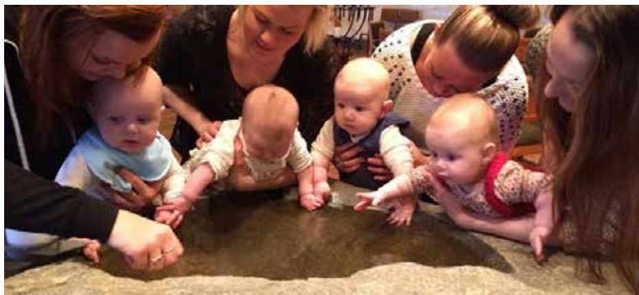
Rossabø menighet gleder seg over stor økning i deltakere på babysang og småbarnsang.