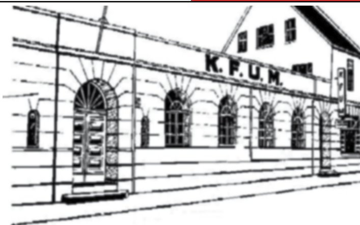
Det var lang kø foran inngangsdøra på KFUM foran Barnas Hyggetime. Storsalen var bak de buede vinduene. Billettluke var bak det lille vinduet til venstre.

- Farfar, ka gjorde dåkker for fjernsynet kom?