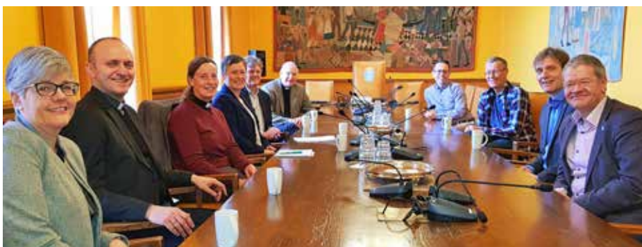
God stemning på møtet med kommuneledelsen i rådhuset.