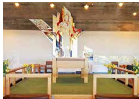
Alteret i Rossabø kirke pyntet til påske.

Ring 52 80 95 00 for kirkeskyss – Vi henter deg gjerne!