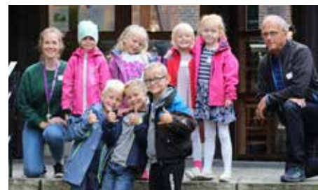
En fin gjeng var samlet til skolestartleir i Vår Frelsers menighet i 2017. De opplevde blant annet skole i gamledager på museet og fikk utforske kirka med orgel og inventar.