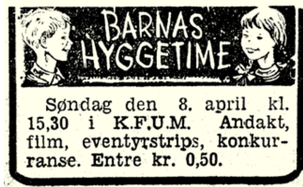
Barnas hyggetime var en suksess. Stavanger kristelige ungdomsforening fulgte opp med et tilsvarende suksessiltak like etter. Senere lånte Haugesund KFUM annonse-vignetten.