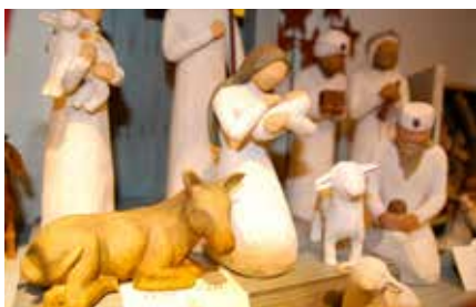
Willow Tree-figurene når bredt ut blant folk og er populære gaver. Julekrybben likeså.