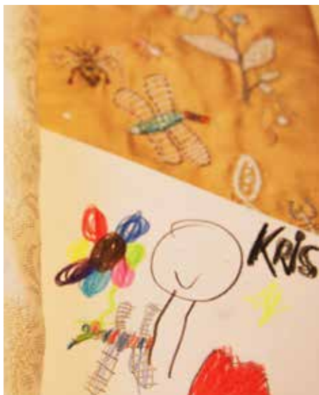
Høytids-klærne til Norges nasjonalhelligdom er laget etter barnetegninger fra Haugesund.

Snart er hun ferdig med sin 18. messehagel, kappen som presten bruker utenpå prestekjolen. Sammen med en stola (det lange kledet til å henge rundt nakken) utgjør den de nye fest-tekstilene til Nidarosdomen. Ræstad var en av tre kunstnere som vant en åpen konkurranse om å levere tekstilene i fjor sommer. Siden har det vært intens jobbing for å bli ferdig til fristen i mars neste år.