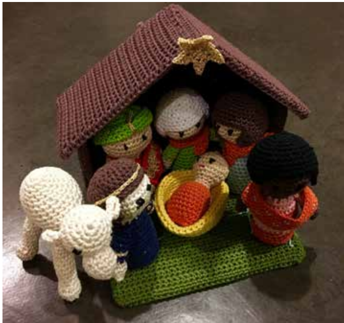
Heklet Julekrybbe til salgs på Adventsdag i Udland