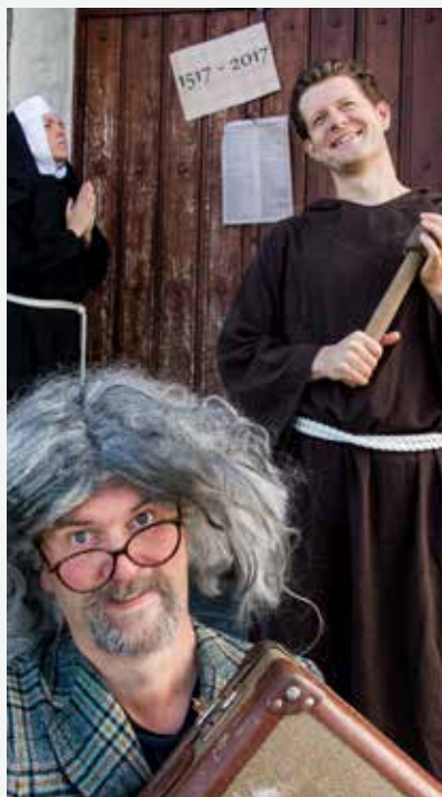
Ryfylke Livsgnist gir oss et humoristisk blick på reformasjonen.

I 2017 feires det at det er 500 år siden Martin Luther slo opp sine teser om avlatshandelen på Slottskirken i Wittenberg. Onsdag 25. januar kl. 19.30 i Rossabø kirke er det mulig å få et historisk og humoristisk skråblikk på hva lutherdommen har ført med seg gjennom 500 år i våre bygder og byer. Ryfylke Livsgnist, kjent for reiser i bedehusland og kirkehistoriske spill på Finnøy, setter denne gang opp en forestilling i kirker i bispedømmet. I beste lutherske ånd blir det mye humor. Ja, alt fra folk som sovner under laaange prekener, konfirmanter som besvimer under overhøring, en gal teologiprofessor, kollekturo, og skråblikk på salmestrid og nyere lovsang.