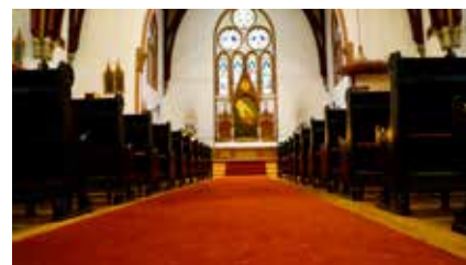
I Vår Frelzers kirke er den røde løperen lagt ut for alle som kommer innenfor døra. Veien fram til alteret er åpen – for alle.

Alle søndagsgudstjenester i Vår Frelzers, Skåre og Rossabø menigheter starter kl. 11.00 hvis ikke annet er annonsert.