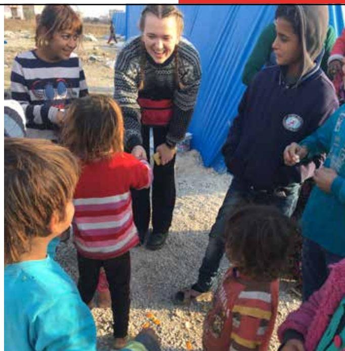
Både følelseløse og traumatiserte, men også glade og lekende barn møtte de frivillige hjelperne.