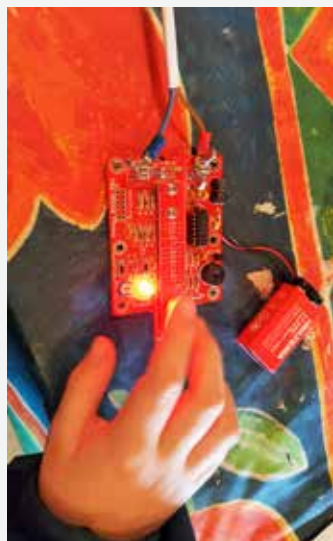
Morse var nytt av året.

Ta kontakt med Oddveig Bergsager tlf. 97 54 63 80 hvis dette kan være aktuelt for deg!