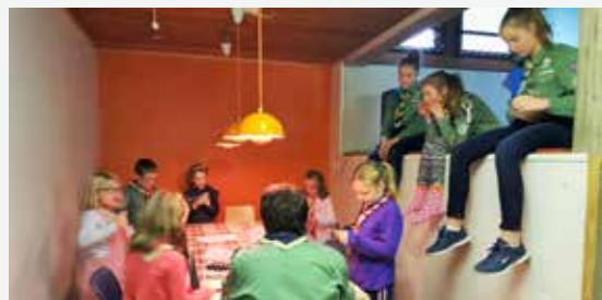
Kjekt med pause på kjøkkenet.