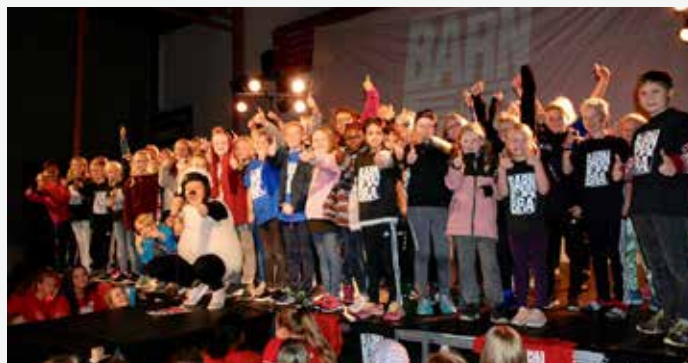
Sauen Ullrik var på besøk fra Strømmestiftelsen og fikk mange nye venner. Denne fine gjengen hadde fullført alle utfordringene på et aktivitetstelt.