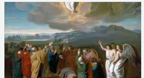
Utsnitt av «Jesu' Ascension to Heaven» av J. S. Copley.