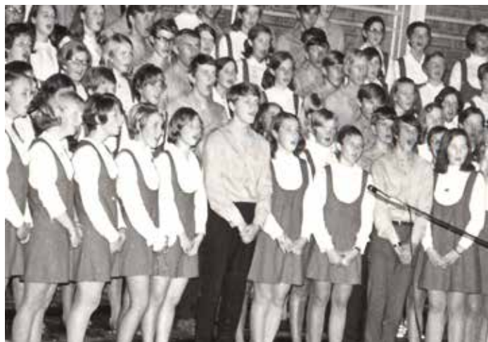
1969: Key Stone Singers i Haraldshallen.