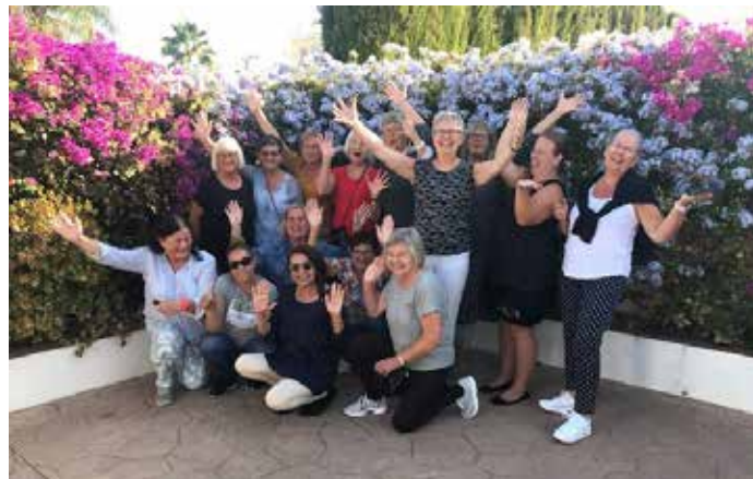
Godt humør og godt fellesskap på Skåres menighetstur for damer til Spania.