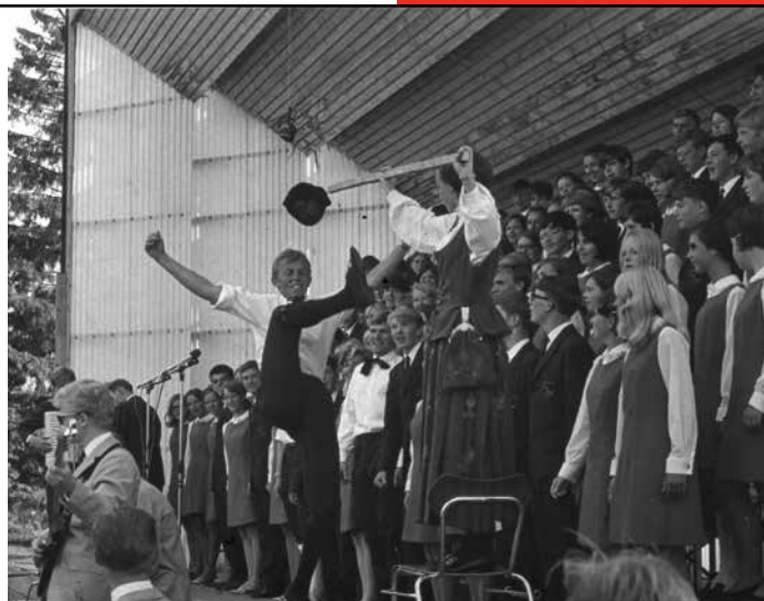
1968: Ten Sing slår gjennom. Koret fra Bergen i aksjon på TT i Sandefjord. Det var rytme, fart og bevegelse – og hallingkast.