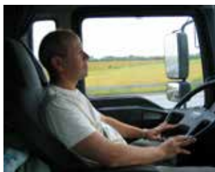
Odd liker seg godt bak rattet.