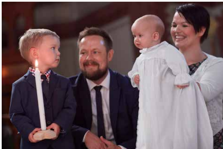
I dåpen har barnet sine viktigste rundt seg. Et nyfødt liv løftes frem i takk og glede!

- Dette blir også en god anledning til å bli bevisst hvordan vi inviterer til dåp. Et stort