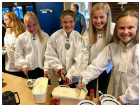
I Vår Frelsers menighet inviteres konfirmantene til isfest og lek, fotografering og kappeprøving noen dager før konfirmasjonen. Til konfirmantbildet med kappe trengs ikke hele bunaden, så da ble det is-spising med bunadsskjorte og bukse!