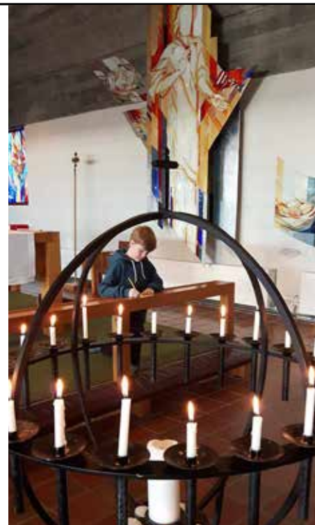
Deltaker på 4T6 i Rossabø kirke.

- Det er vanskelig å sirkle inn noen få hoved-