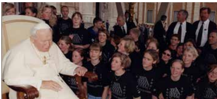
2001: Key Stone Singers hos pave Johannes Paul II i Roma.