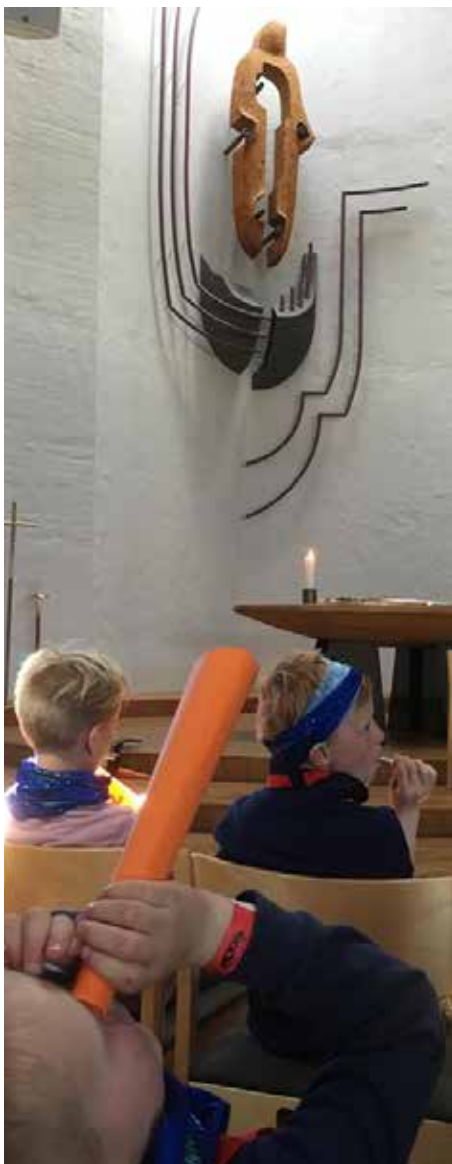
En Tårnagent studerer Udland kirke med kikkert.

forvirrende for barnet. Jeg tenker også at om barna forbinder Gud med liv, lys og glede, har de møtt skinnen av det glade budskap. Evangeliefortellingene om Jesus er helt sentrale å formidle fordi de forteller på en konkret måte hvem den treenige Gud er. Samtidig er det slik, i alle fall innen luthersk teologi, at Gud ved sin Ånd skaper troen hvor og når Gud vil. Det er et mysterium og sier også at tro er noe som verken barn eller voksne rår over. Den kan bare tas imot som en gave.