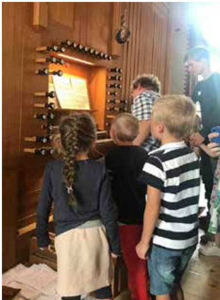
I Vår Frelsers kirke får førsteklasingene utforske orgelet.

- Som barn danner de aller fleste seg bilder og forestillinger om Gud. Disse forestillingene er knyttet til flere forhold. Emosjonelt er de ofte knyttet til konkrete erfaringer som barnet gjør i møte med sine første og nærmeste omsorgspersoner. Etter hvert vil de også ofte være preget av ord som er sagt om Gud, enten av noen i familien, venner, på søndagsskolen, i forkynnelse eller andre steder. Også bilder og symboler av Gud vil prege barnets tro. Barnet har også en forestillingsevne som kan veve sammen elementer fra virkelighet og fantasi, og slik lage en tro som er barnets helt egen tro. Voksne vil ofte kalle den troen som de husker