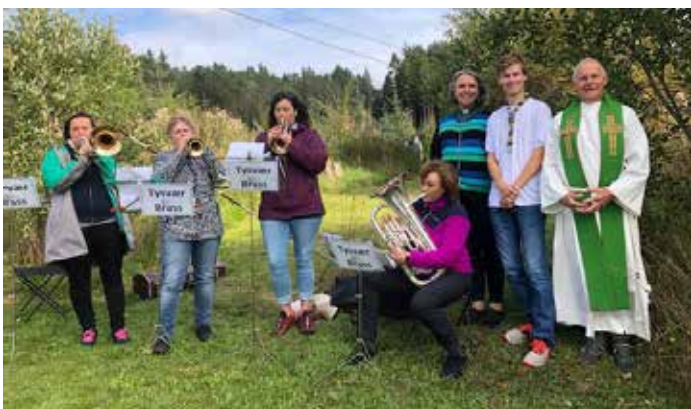
Tysvær Brass, bestående av 4 blåsere og forsangere fra Kantoriet var meget godt tonefølge til salmene!

Nesten 60 møtte opp til friluftsgudstjeneste i Djupadalen under Friluftslivets dag 2. september.