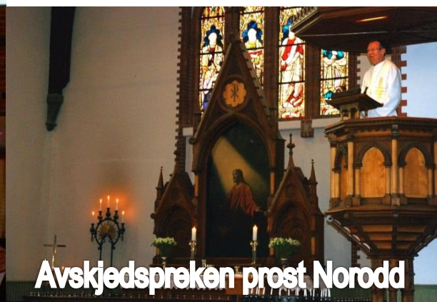
Avskjedspreken prost Norodd