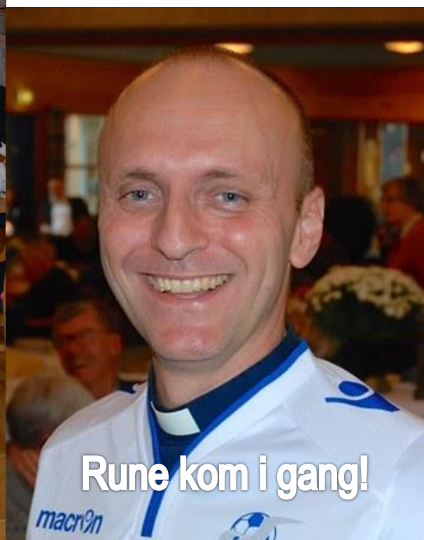
Rune kom i gang!