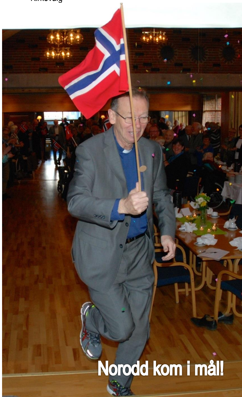
Norodd kom i mål!