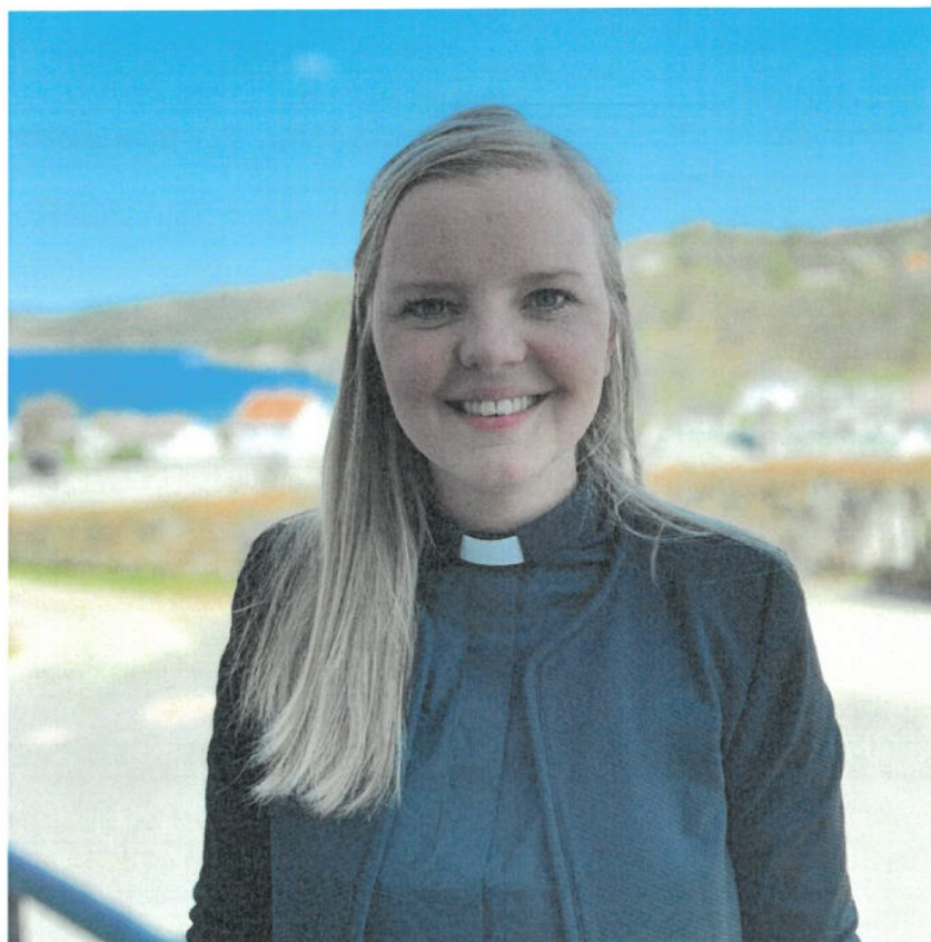
Ingvild dro – Nina kom!