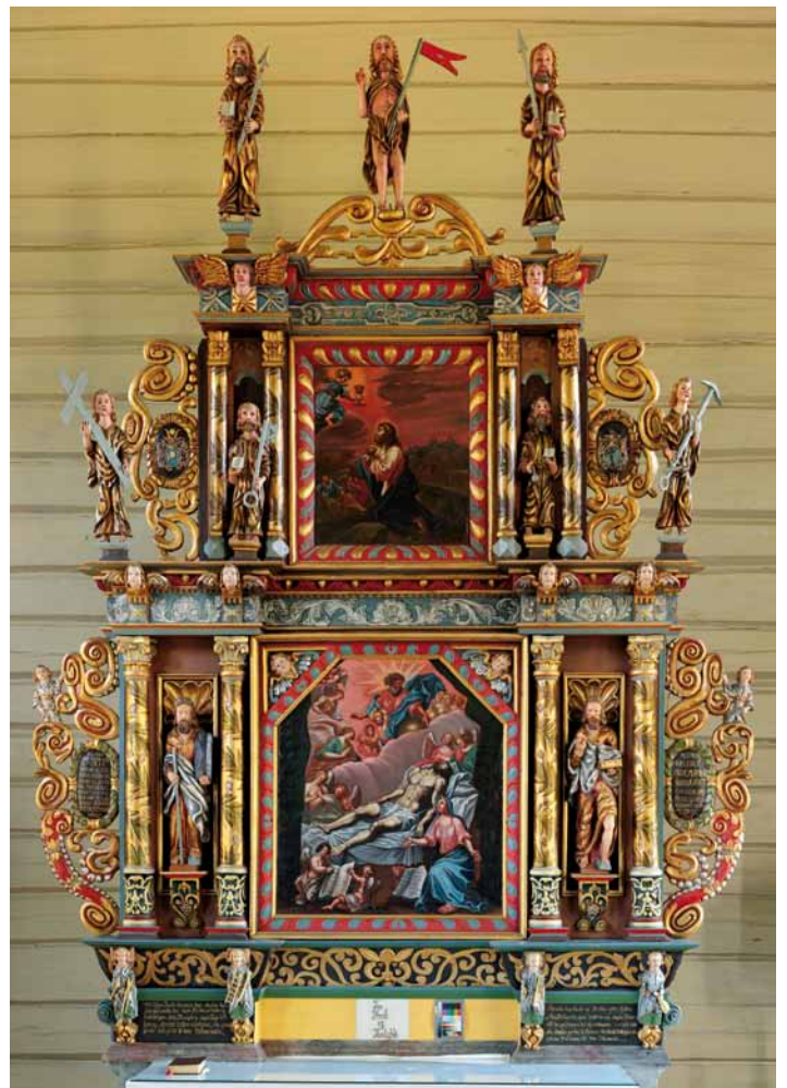
Altertavla i Vinje kirke