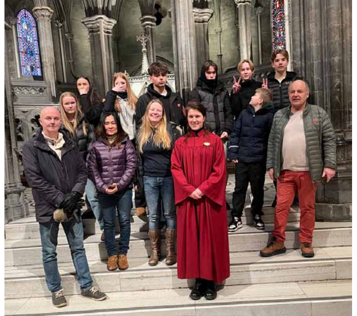
Halsakonfirmantene på Trondheimstur.