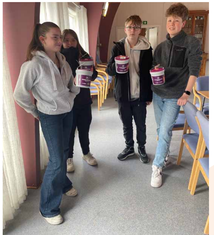
Konfirmantene klar for Fasteaksjonen 2024.