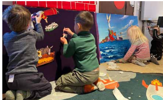
Barnehagebesøk i Valsøyfjord.