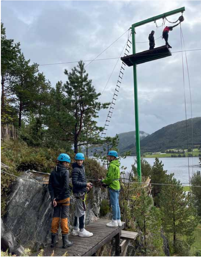
Konfirmantene på fellessamling på Høyt-og Lavt på Valsøya .