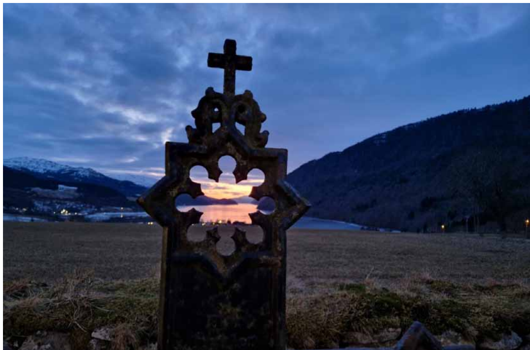
Utsikt fra Vinje kirke

Endringer kan forekomme. Se også lokalavisene og kirken.no/heim