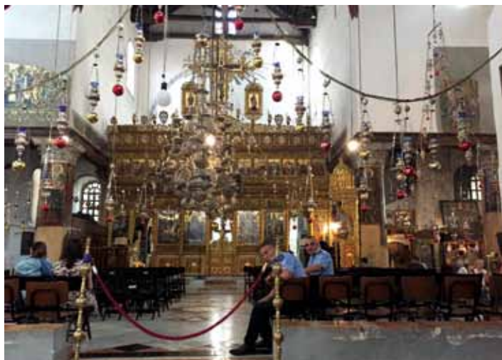
Det er ikke spart på kunst og utsmykninger

Og hit kommer det folk, hele tiden. Julesangen har rett: «Nå vandrer fra hver en verdens krok..... til Betlehem». Du ser på hudfarge og klesdrakt at de kommer fra alle kontinenter. Du hører det på sangen deres, som bølger fra gruppe til gruppe. Og du fascineres av at de viser sin tro. De korsers seg, igjen og igjen. Og når de er der nede i krypten under hovedalteret, og sølvstjernen i gulvet er innen rekkevidde, da faller noen på kne og kysser den. De tenker ikke på hygienen, eller på de som går tett inntil med kameraet for å få et nærbilde av den fromme. Det er bare én ting som fyller dem: Nå er de her, den ene gangen i livet, her Jesus ble født.