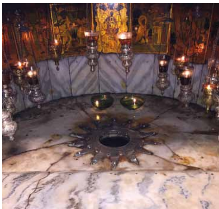
Her ble Jesus født

Betlehem, brødhuset, er kjent fra det gamle testamente. En profeti ser ut til å treffe som en innertier: «Men du, Betlehem, Efrata, den ringeste blant ættene i Juda! Fra deg lar jeg komme en mann som skal være hersker over Israel. Han har sitt opphav i gammel tid, han er fra eldgamle dager.» Mika 5.1. I Betlehem er det kun en fortelling som passer til profetien, fortellingen om Jesu fødsel.