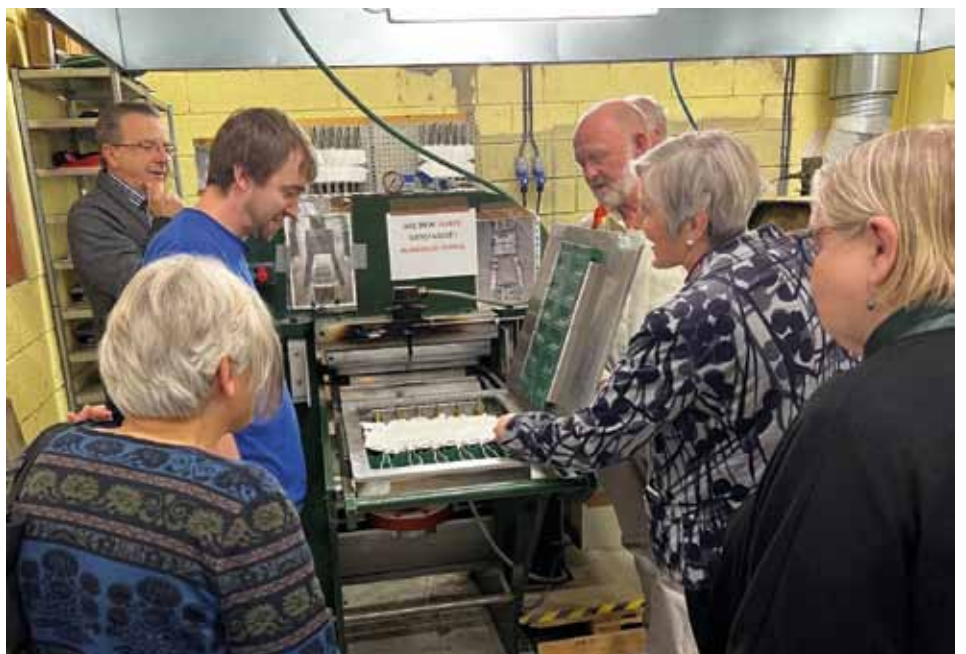
Fra Allvekst, Kyrksæterøra. Her lages det slikkepotter.