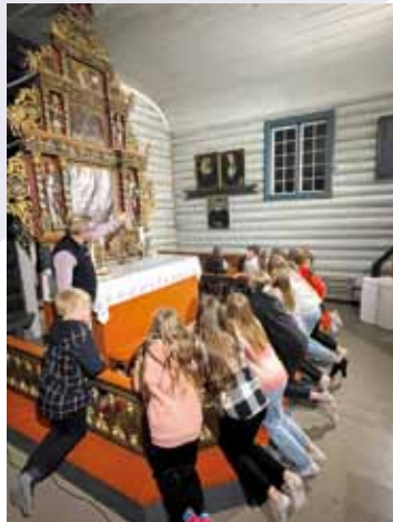
Lysvåken-aften i Halså kyrke

Vi fortsetter med Hobbyklubb på torsdager og program for våren ser slik ut: