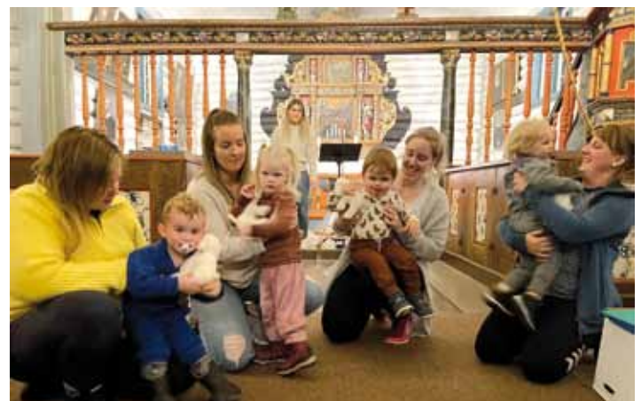
Fra krøllekveld i Halså kyrkje

Det er lett å følge med på det som skjer om du trykker « liker » på Trosopplæringen i Heim på Facebook