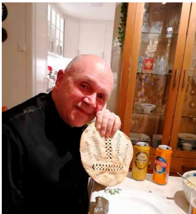
På Island har de også en annen spesiell type islandsk julemat, en tynn og sprø loff.