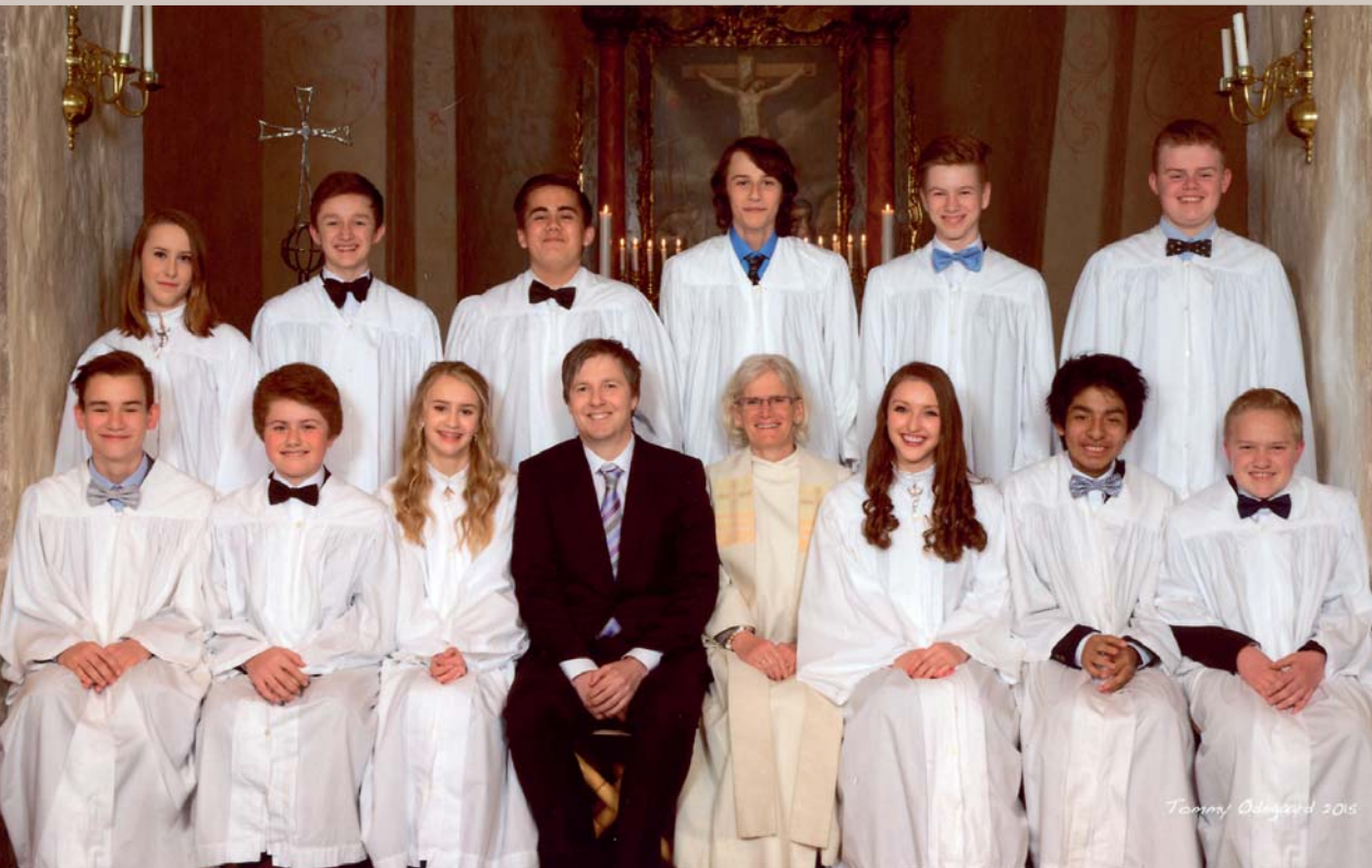
Konfirmantene i Hvaler kirke