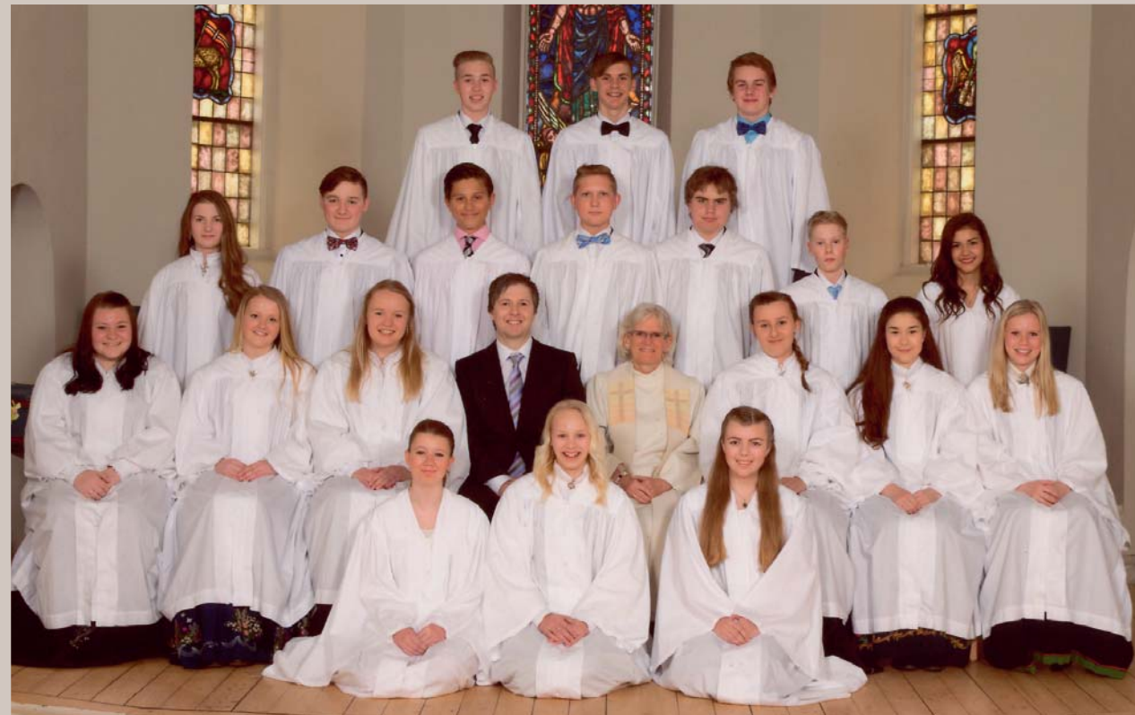
Konfirmantene i Spjærøy kirke