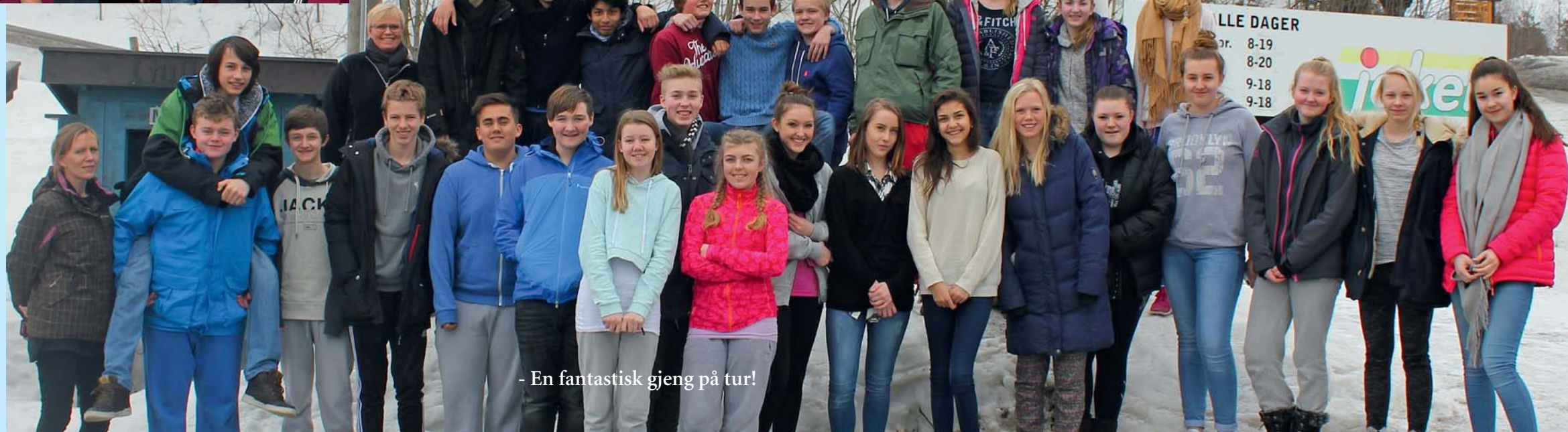
- En fantastisk gjeng på tur!