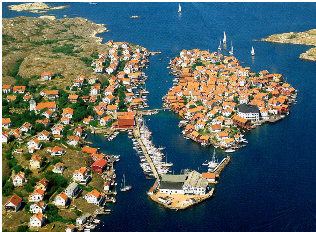
Gullholmen, med Hermanö til venstre.

Härm. Dette er en av vestkystens travleste gjestehavner og man skjønner etter hvert hvorfor. Her finnes alle fasiliteter som båtturistene ønsker seg. Vann, strøm, sanitæranlegg med bra dusjer, dagligvarebutikk, museer, kunstutstillinger, restauranter, cafeer og mye mer. Havna er i tillegg lun og du ligger trygt fortoyd i faste akterfortøyinger.