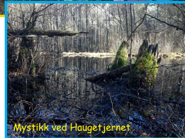
Mystikk ved Haugetjernet

skolepulten. Fysisk aktivitet, frisk luft og nye impulser er godt for de yngste barna i en ellers så hektisk og krevende hverdag. Forskning viser også til at fysisk aktivitet og god helse fremmer gode læringsforhold for barna i alle aldre.