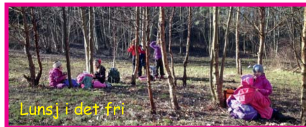
Lunsj i det fri

Vi oppfordrer herved alle til å ta turen ut og nyt Hvalers flotte natur og skjærgård!