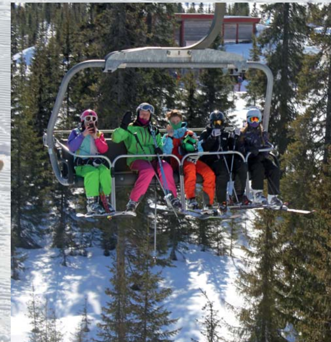
- I Stolheisen med Hvalerkonfirmanter som er klar for en ny slalomrunde.