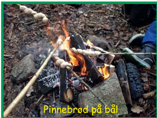
Pinnebrød på bål

Elevene storkoser seg på disse uteskoledagene og får et kjærkomment avbrekk fra