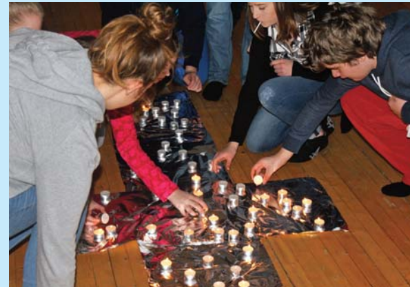
- Fredag og lørdag var det samlingsstund med lovsang og lystenning. Søndag formiddag var det gudstjeneste med nattverd.