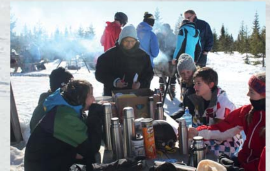
- 3 timer på fredag ettermiddag var konfirmantene gjennom SOFA, en utfordrende aktivitetsløype der samarbeid var viktig for å klare oppgavene.