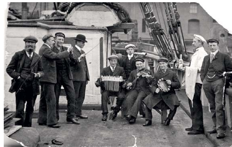
Uvanlig og morsomt mannskapsbilde fra seilskute i 1903. Bildet er sendt hjem til Hvaler som postkort.

Hvaler har lange sjøfartstradisjoner og har gjennom årene fostret tusenvis av sjøfolk. At Hvalergutten skulle til sjøs, var en selvfølge. Så snart konfirmasjonen var overstått, var det forventet at de skulle kunne forsørge seg selv. Guttene hadde få muligheter til valg av yrke gjennom 1800-tallet og første del av 1900-tallet. Sjøen var og ble derfor den veien de fleste fulgte.