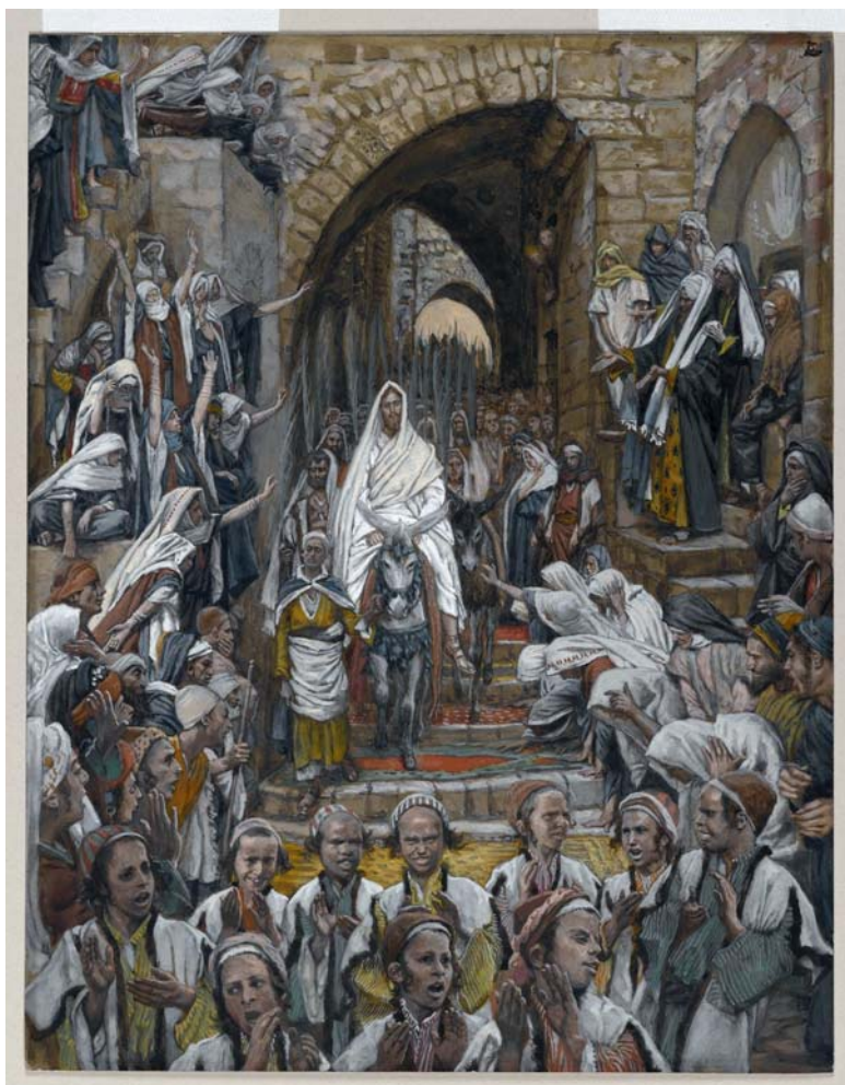
The Procession in the Streets of Jerusalem av James Tissot. (1836-1902)

Dagen etter fikk folkemengden som var kommet til festen, høre at Jesus var på vei inn i Jerusalem. Da tok de palmegreiner og gikk ut for å møte ham, og de ropte: