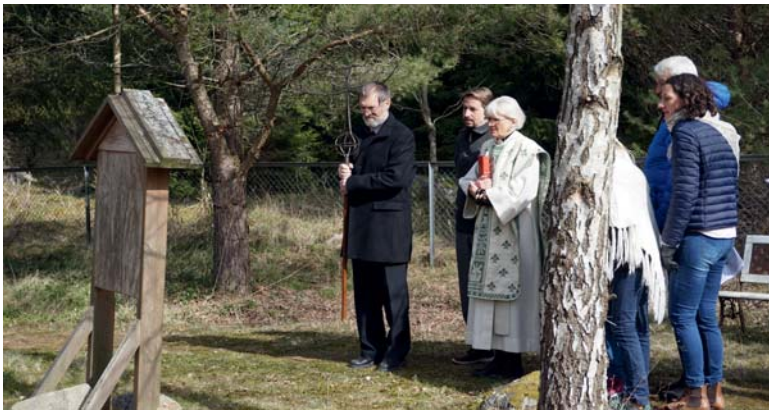
Fra en tidligere påkestivandring

Påkestien er en meditativ vandring i verdenshistoriens største drama; Jesu død og oppstandelse. Ved hjelp av bilder, symboler og bibeltekster formidles hovedinnholdet i den kristne påske. Med nærhet til middelalderkirken og kirkegårdens