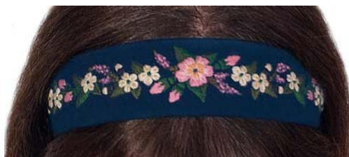
Hårbånd blå Hvalerdrakt

kneppes, men som er til pynt, hvit bomulls- eller linskjorte med stående halslinning, og litt vidde i skjortermene.