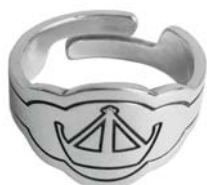
Sølvring Hvalerdrakt, begge