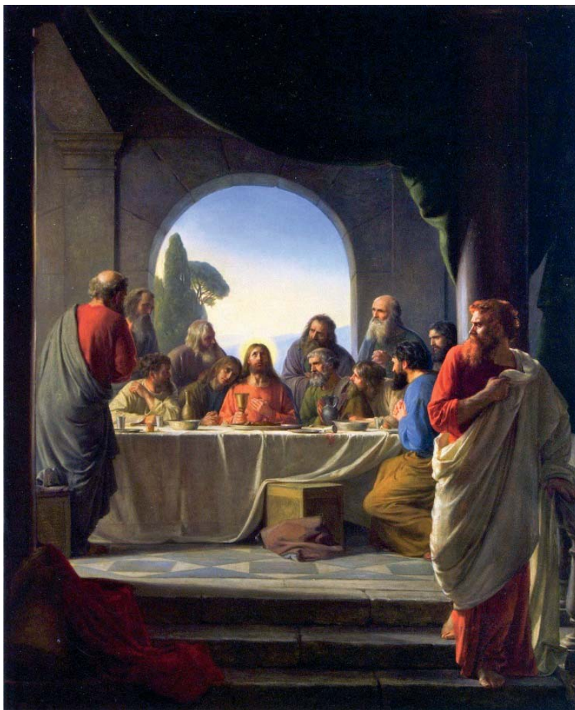
The last supper av Carl Bloch (1834-1890)

Da det ble kveld, tok Jesus plass ved bordet sammen med de tolv. Mens de spiste, sa han: «Sannelig, jeg sier dere: En av dere skal forråde meg.» Da ble de dypt bedrøvet, og den ene etter den andre sa til ham: «Det er vel ikke meg, Herre?» Men han svarte: «Den som har dyppt hånden i fatet sammen med meg, han skal forråde meg.»