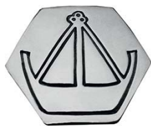
Sølvknapp Hvalerdrakt mann