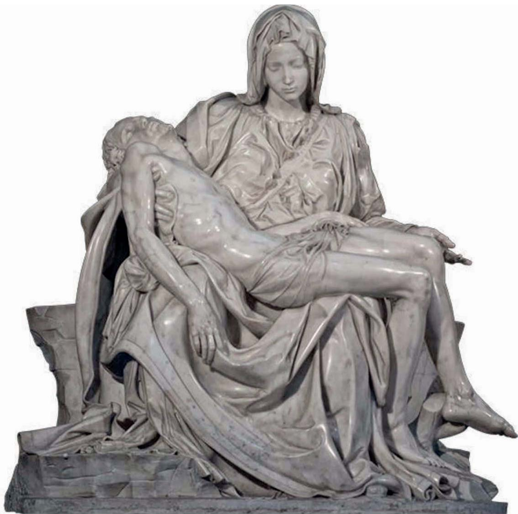
Pietà av Michelangelo

Da det ble kveld, kom en rik mann som het Josef. Han var fra Arimatea og var også blitt en disippel av Jesus. Han gikk til Pilatus og ba om å få Jesu kropp. Pilatus ga da ordre om at den skulle bli utlevert. Josef tok Jesu kropp, svøpte den i et rent linlede og la den i en ny grav, som var hugget ut til ham selv i bergveggen. Så rullet han en stor stein foran inngangen og gikk. Men Maria Magdalena og den andre Maria var der. De satt rett overfor graven.