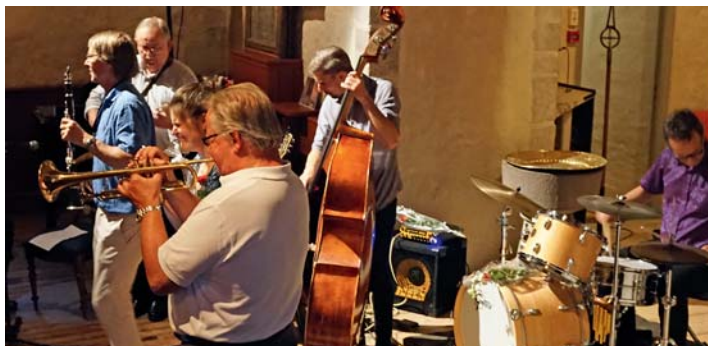
Magnolia i kirken