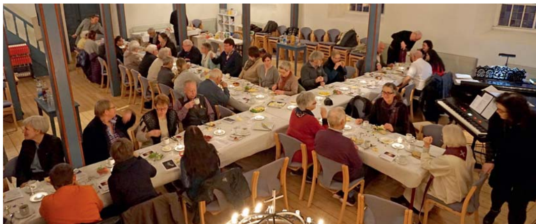
Skjærtorsdagsmåltid i kirken hvor bordet er formet som et kors.