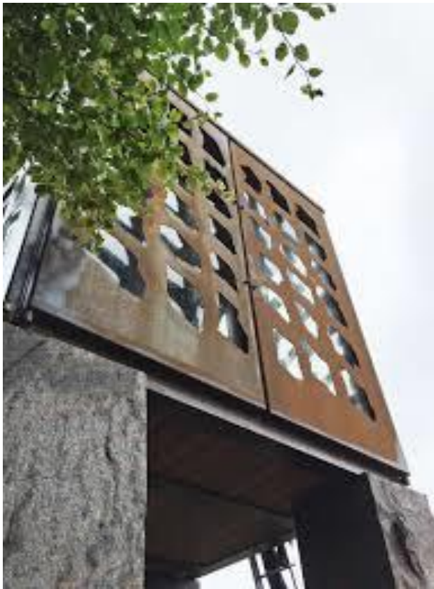
Eksempel på Cortenstål