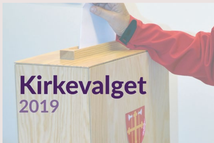
Bilde og illustrasjon: © Kirkerådet