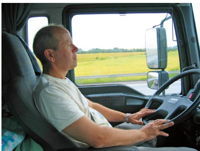
Odd liker seg godt bak rattet.