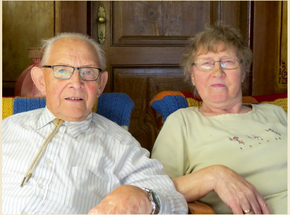
Ekteparet synes det er godt å være to.

Det må den vitale 90-åringen si seg enig i.