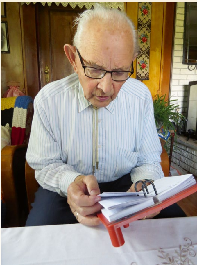
Ola har mange syvende sanser han har skrevet opp mangt og mye i.