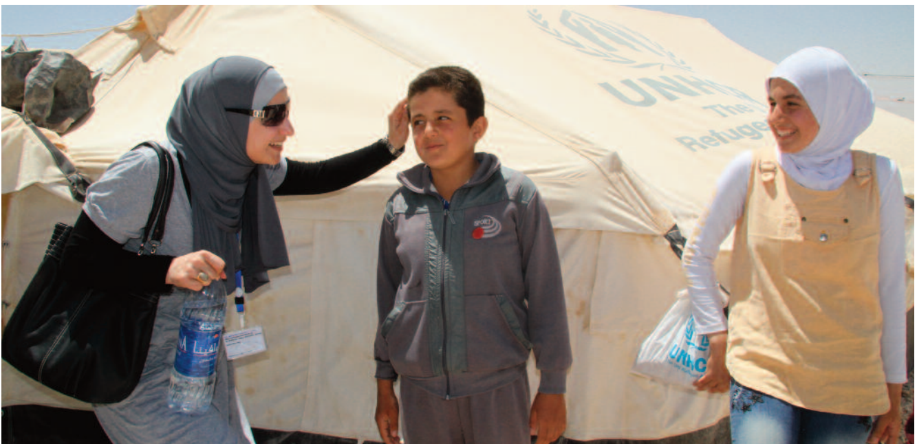
Weidan Jarran i arbeid i flyktningeleiren Zataari i Jordan

Fasteaksjonen gir oss en mulighet til å gjøre noe konkret med alt det vonde vi hører om i nyhetene. Vi kan bidra. Det som akkurat du gjør, fører til at hjelpen når flere. Denne muligheten har vi hvert år. Varig støtte til Kirkens Nødhjelp er sunt for alle aldersgrupper. Det gjør kirken troverdig i kampen for en mer rettferdig verden. Vi sier ikke bare hvor ille det er, men vi handler.