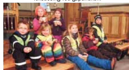
Godt med varm saft i kirka vår etter lysvandringa.