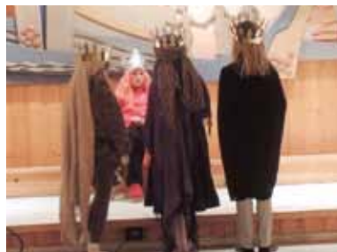
Herodes og de hellige 3 konger.