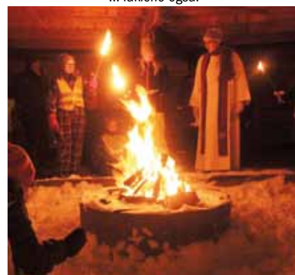
Tekstlesing ved gapahuken.