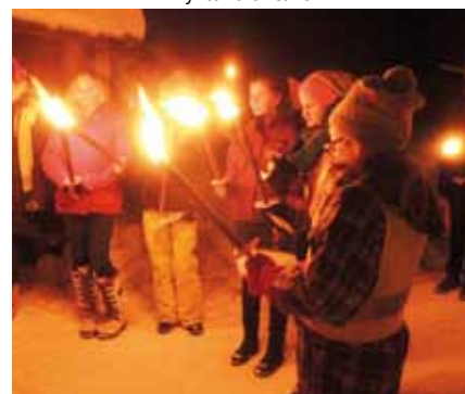
... faklene også.