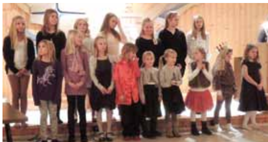
Julekoret sang på Hellige 3 Kongers fest.