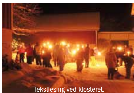
Tekstlesing ved klosteret.

Leksvik Forsamlingshus 13. april kl 19.00