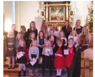
Flotte sangglade barn i julaftengudstjenesten i Stranda kirke.