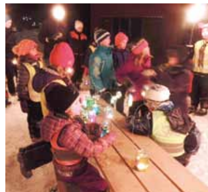
Lyktene er tent

Forandringer i gudstjenesteoppsettet kan forekomme. Følg derfor med på kunngjøringer og oppslag!