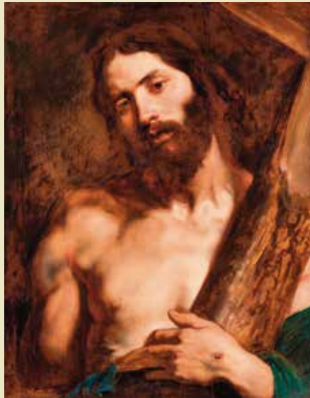
«Kristus bærer korset», maleri av Anthonis van Dyck (1599–1641) i Musei di Strada Nuova i Genova

Det er godt over 10 år siden jeg ble bedre kjent med kirken og den kristne troen gjennom sang og musikk. Jeg ble sett og hørt, og det var to ting som spesielt gjorde det mulig for meg å kjenne på en annen tro enn den jeg hadde hatt tidligere. For det første oppdaget jeg at jeg aldri er alene, jeg har alltid en som går ved min side, i tykt og tynt, i gode og onde dager, og det er Jesus. Det andre jeg fikk kjenne, er at jeg er verdifull. Det var en følelse