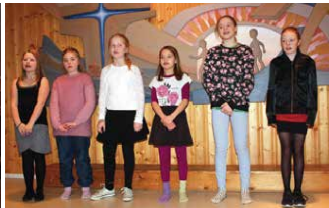
Det klinger godt i Stranda Julekor, selv om ikke alle hadde mulighet for å møte.