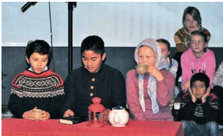
Historien om den fattige skomakeren Adjevitsj ble fortalt og dramatisert.