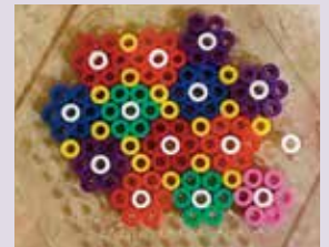
Fotografi av perlebrettet til Vanja Brandås, 8 år. Man gir blomster til dem man er glad i.