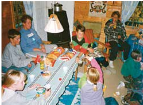
Barneforeningen for mange år tilbake. Er det noen som kjenner seg igjen?