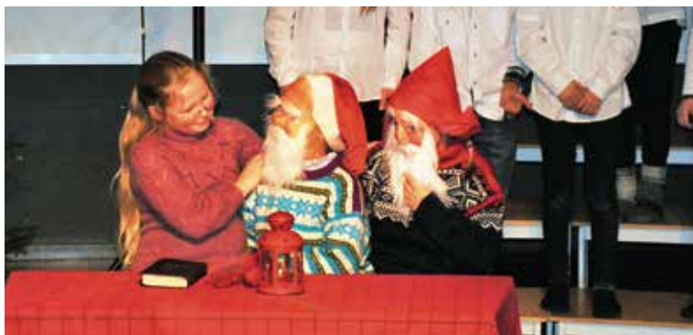
«Så kom det julebukke å en stakkars lell»