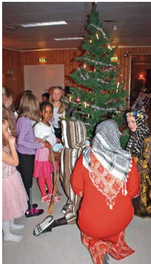
Historien om de Hellige 3 konger dramatiseres godt av barn og ungdom i Vanvikan.