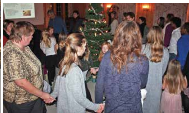
Gang og sang rundt juletreet engasjerte små og store.