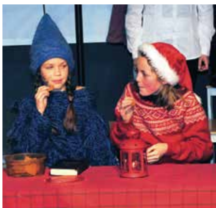
Rødningen og blåningen som geleidet publikum gjennom forestillingen.