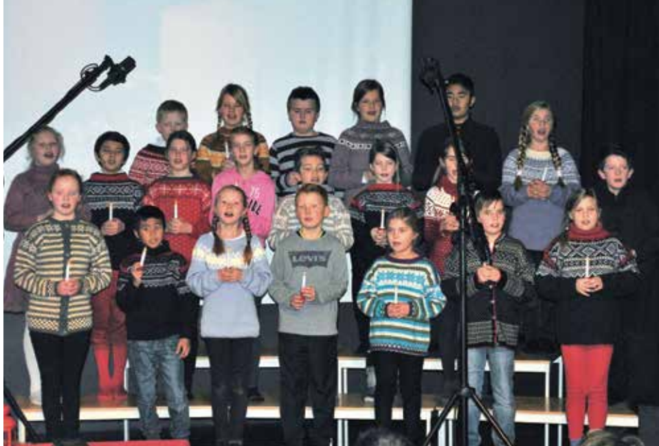
Julestemninga kom da koret sang første sang: Tenn Lys!

Barna i koret har bestemt at overskuddet fra årets forestilling skal gå til Frelsesarmeens julegryte i Trondheim.