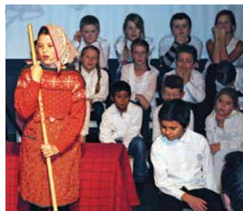
Julekveldskrisa lokket fram latter hos publikum.