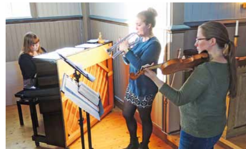
I påsken var det ekstra mange musikere og sangere i aksjon under gudstjenestene. Her fra skjærtorsdag i Stranda kirke.