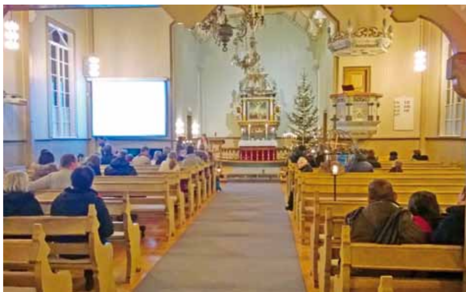
Det var godt oppmøte på Lysmessa i Stranda kirke hvor speiderne deltok.