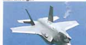
F-35, lander snart på Ørlandet