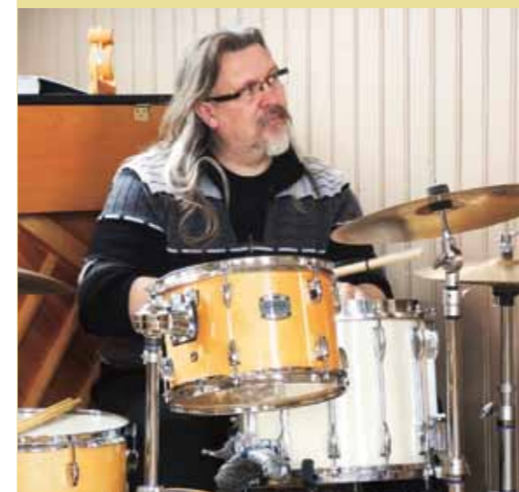
Kaya fikk blant annet akkompagnement av denne karen på trommer.