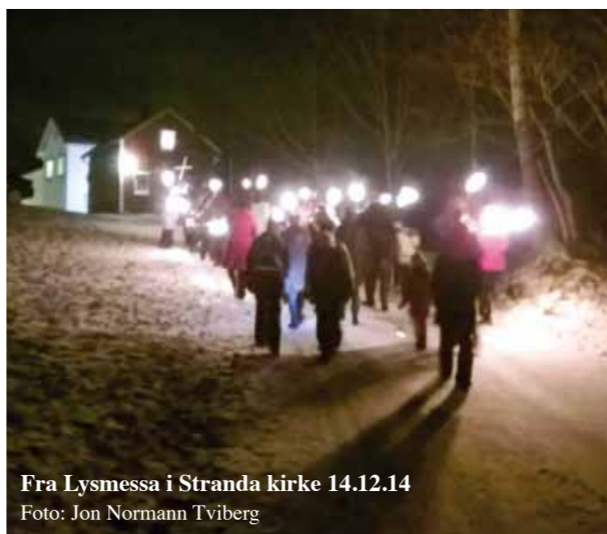
Fra Lysmessa i Stranda kirke 14.12.14