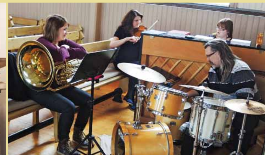
Her øves det før gudstjenesten i Stranda kirke påskedag. Lang reisevei hindret ikke disse musikerne i å delta. De kom fra Verrabotn og Verdal.