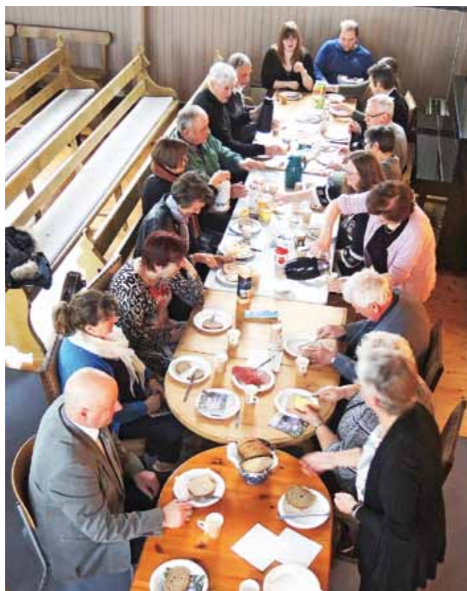
Stranda Menighetsråd har i flere år arrangert kveldsmåltid etter gudstjenesten skjærtorsdag i Stranda kirke. Dette har blitt et godt besøkt og trivelig tiltak, og det blir flere og flere fra menigheten som deltar for hvert år.