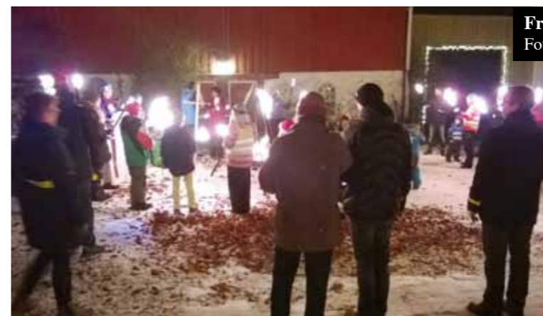
Fra Lysmesse i Stranda.