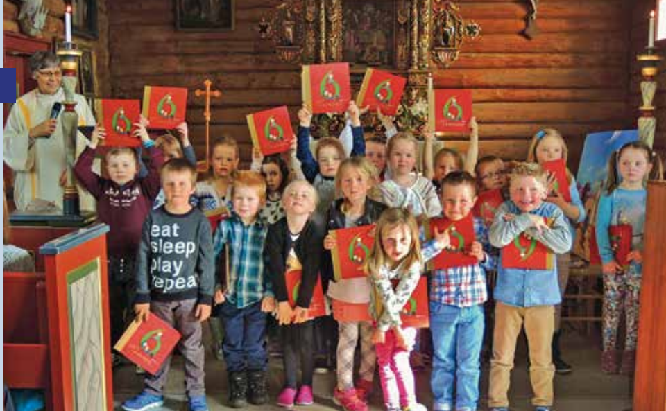
Endelig! Glade 6-åringer har fått bok i gudstjeneste i Leksvik kirke.