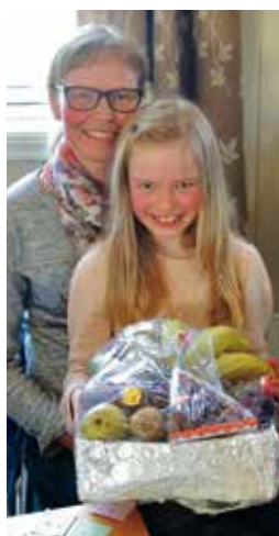
Den heldige vinneren av kveldens hovedpremie delte gjerne gleden med tante.