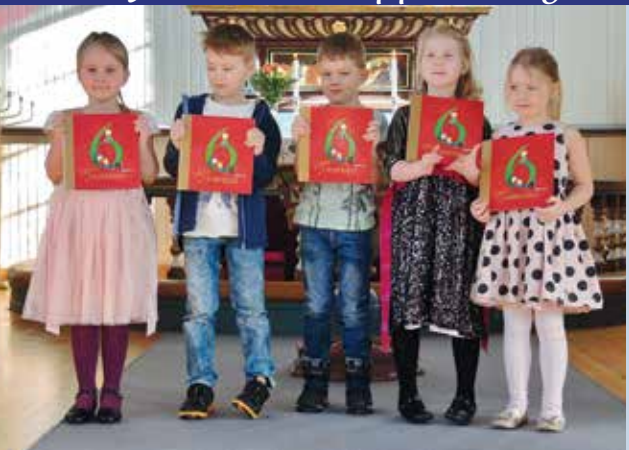
Fornøyde barn har fått 6-årsbok i Stranda kirke.