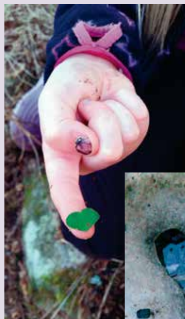
Hjerteform i snø som smelter.