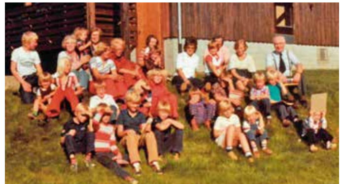
Dette bildet er tatt på avslutning på søndagsskolen i 1978. Turen gikk til Høylandet og Drageid Kapell som vi ser i bakgrunnen.