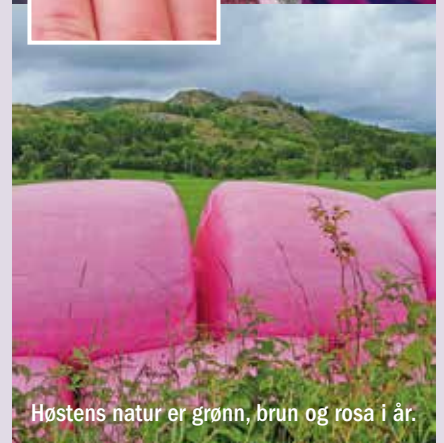
Høstens natur er grønn, brun og rosa i år.