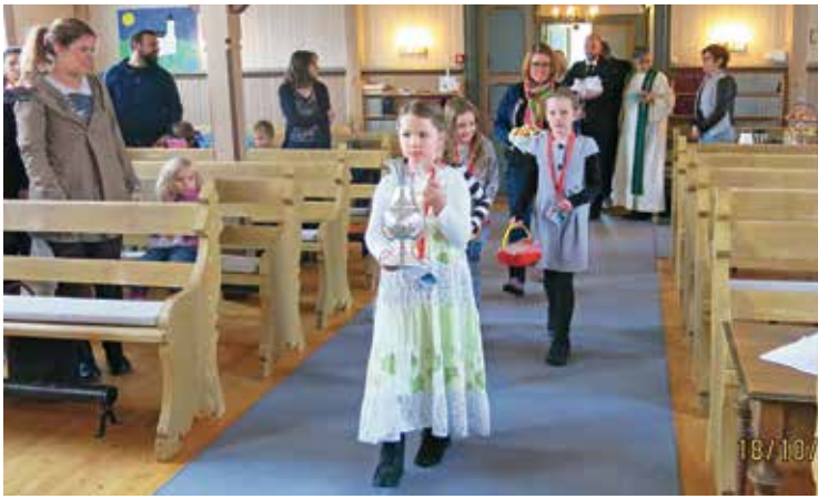
Tårnagenter i prosesjon.