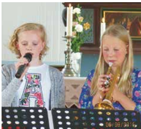
Flinke musikere på 4 årsgudstjeneste.

Alle agenter må ha mat, så vi koste oss med saft, vafler og frukt. Sånn ca kl 8 på kvelden