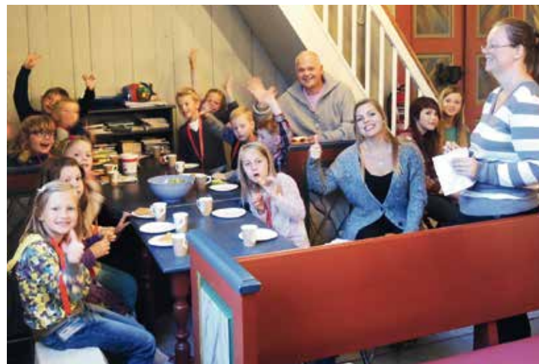
Det er pause for Tårnagenter og gode medhjelpere blant konfirmanter, foreldre og andre, og da hører selvsagt god mat med.