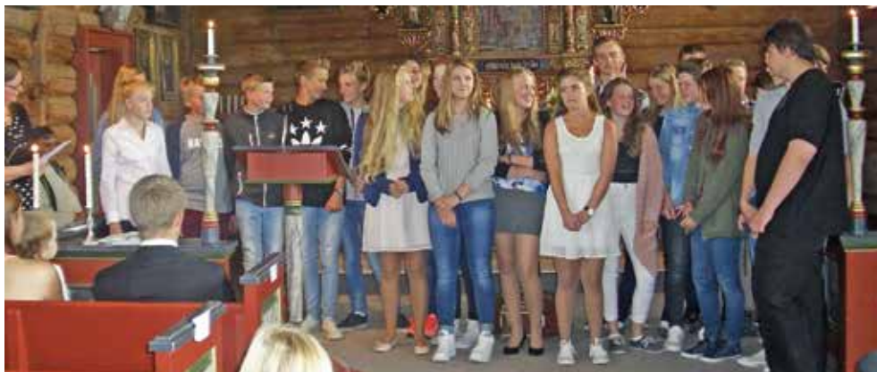
Konfirmanter i Leksvik.