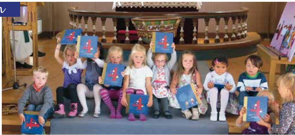
4-åringer med bok.

Vi sang noen sanger vi hadde lært oss. Blant annet hvem har skapt alle blomstene. De som ikke har fått 4 årsboka, og ønsker den ta gjerne kontakt med menighetskontoret så skal dere få den! Her ser du de stolte 4 åringer med boka si. ☺