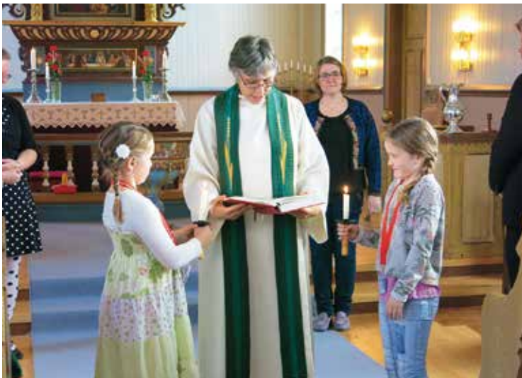
Tårnagenter lyser opp ordet.