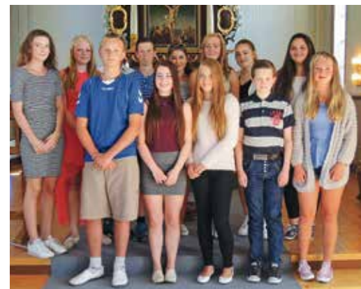
Her ser dere årets flotte konfirmanter i Stranda.