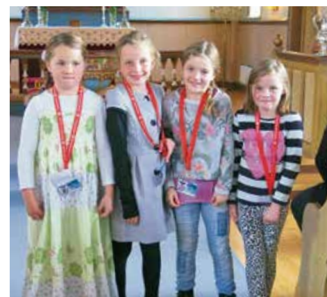
Tårnagentene i Stranda.