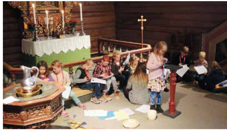
Etter pausen er det klart for enda flere aktiviteter i det spennende kirkerommet.