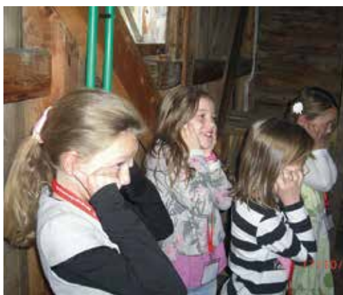
I tårnet, Stranda.