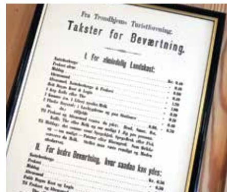
Fasinerende lesing på denne plakaten fra 1892 fra Trondhjems Turistforening, med todelt takster: «For almindelig Landskost», og «For bedre Beværrting, hvor saadan kan ydes».

Storlidalen. Vi besøkte Vognildsbua Museumsbutikk, fikk guiding av lokal guide inn til Storlidalen og til fjellgarden Bortistu Gjestegard. Her ble det omvisning i den gardshistoriske utstillingen med fortellinger fra hverdagslivet på fjellgarden de siste 100 årene. Ikke farlig å sette turen hjemover etter nydelig middag med lokalprodusert badsturøkt lammelår, dessert og kaffe.