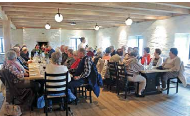
Ingenting å klage på ved middagsbordet når nydelig badsturøkt lammelår ble servert.