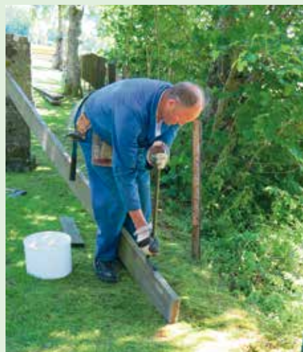
3 flinke mannfolk som står på og sørger for at kirkegården på Hindrem får ett nytt flott gjerde.

Bygda har en god dugnadsånd og 3 mann tok oppgaven-en til å rive ned og rydde, og to til å sette opp ny. På flere av dagene ble det ordnet med bevertning. Når dette bladet går i trykken er nok gjerdet ferdig!