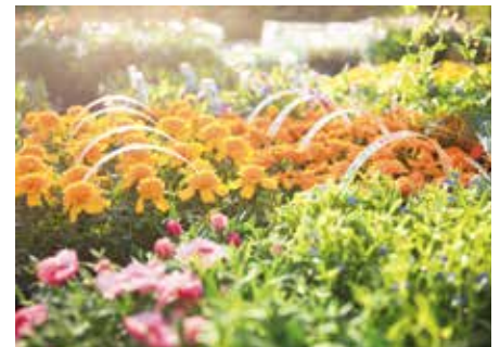
Se så herlig og fine blomster som er å få kjøpt av damene på plantedag!

I år gikk plantedagen «sånn passe». Det var for kaldt enda og vi hadde det dårligste salget hittil. Folk ble nok skremt av snøen som kom i går. Vi synes jo at dette er et godt tilbud som folk bør benytte seg av. Man slipper å dra på butikken før man skal på kirkegården, alt er tilgjengelig på kirkegården. Vi har både planter, jord og selvvanningskasser. I tillegg til at vi serverer kaffe og lapper med hjemmelaget gomme. Det er veldig hyggelig med alle som kommer innom og slår av en prat. Det setter vi pris på!