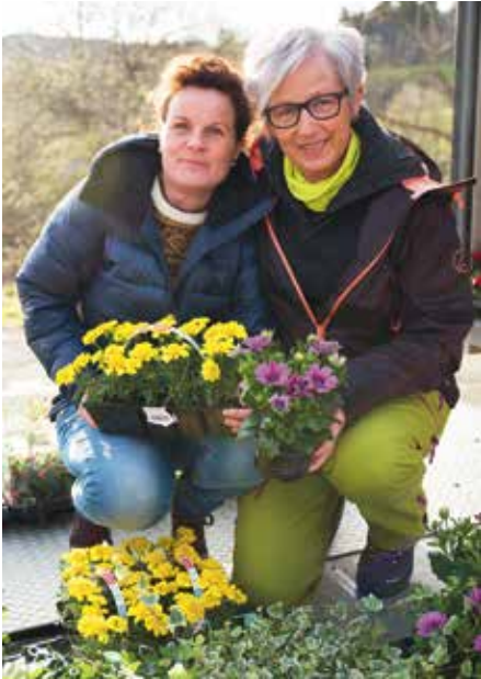
To blide damer omgitt av blomster i kveldssolen.