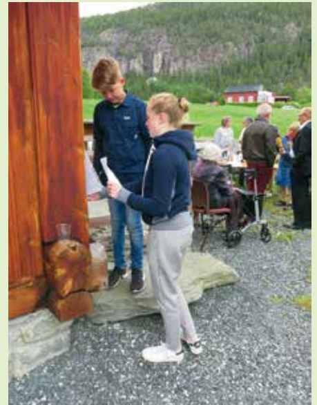
2 ivrige ungdommer som er med på naturstien rundt kirka