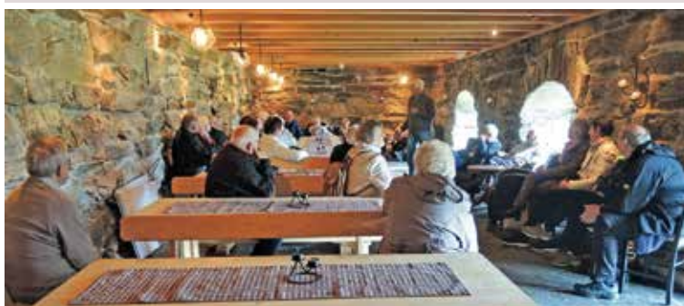
Vertskapet ved fjellgarden Bortistu Gjestegard fortalte ivrig om historien til garden. Her sitter vi i fraukjelleren.