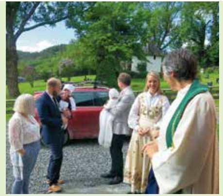
Dåpsbarn med foreldre møter presten før sommergudstjenesten.