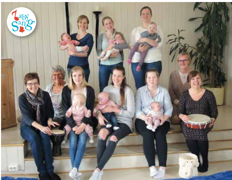
Siste babysang-samling før sommeren.