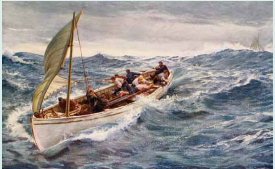
The Crew (Mannskapet) av Charles Napier Hemy (1841–1917). Aberdeen Art Gallery.