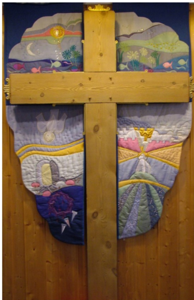
Alterteppet i Roverud kirke