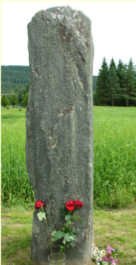
Bautasteinen på Fyirilunda kirketuft

omrisset av den gamle kirken. Han hadde endelig funnet det rette stedet! Steiner fra fjern og nær som er funnet ”verdige” til å ligge på vigslet jord er nå plassert som grunnmur, og en flott bautastein fra gamle Vinger er på plass slik at kirken eller ruinene slik sett er ”gjenreist”.