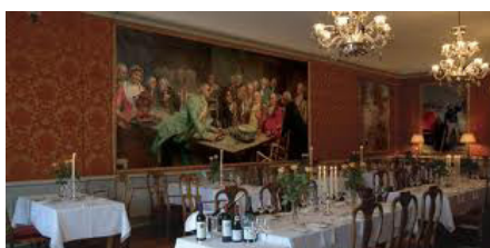
Den store spisesalen