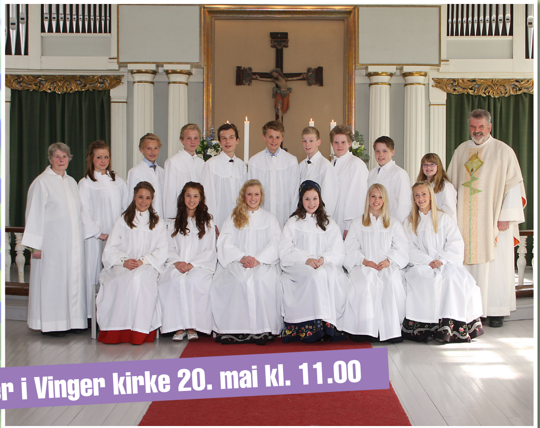
Konfirmanter i Vinger kirke 20. mai kl. 11.00