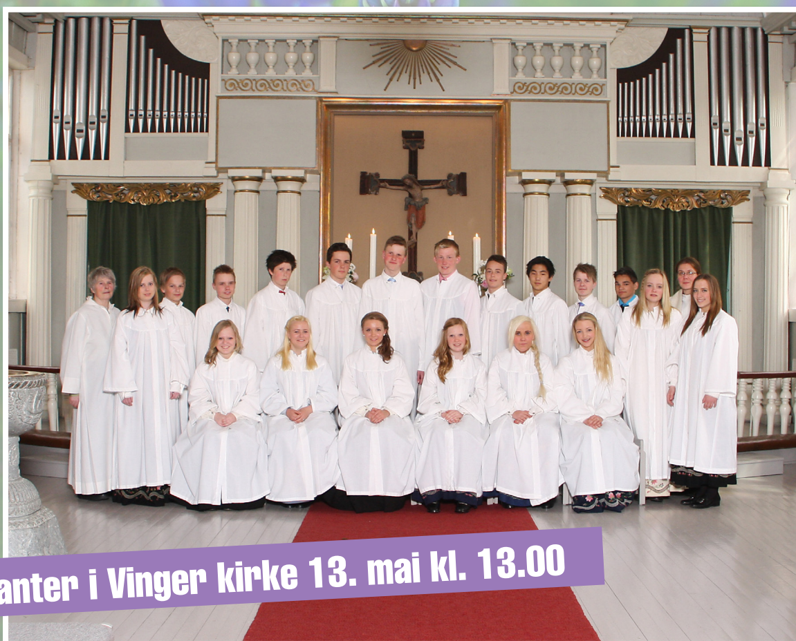
Konfirmanter i Vinger kirke 13. mai kl. 13.00