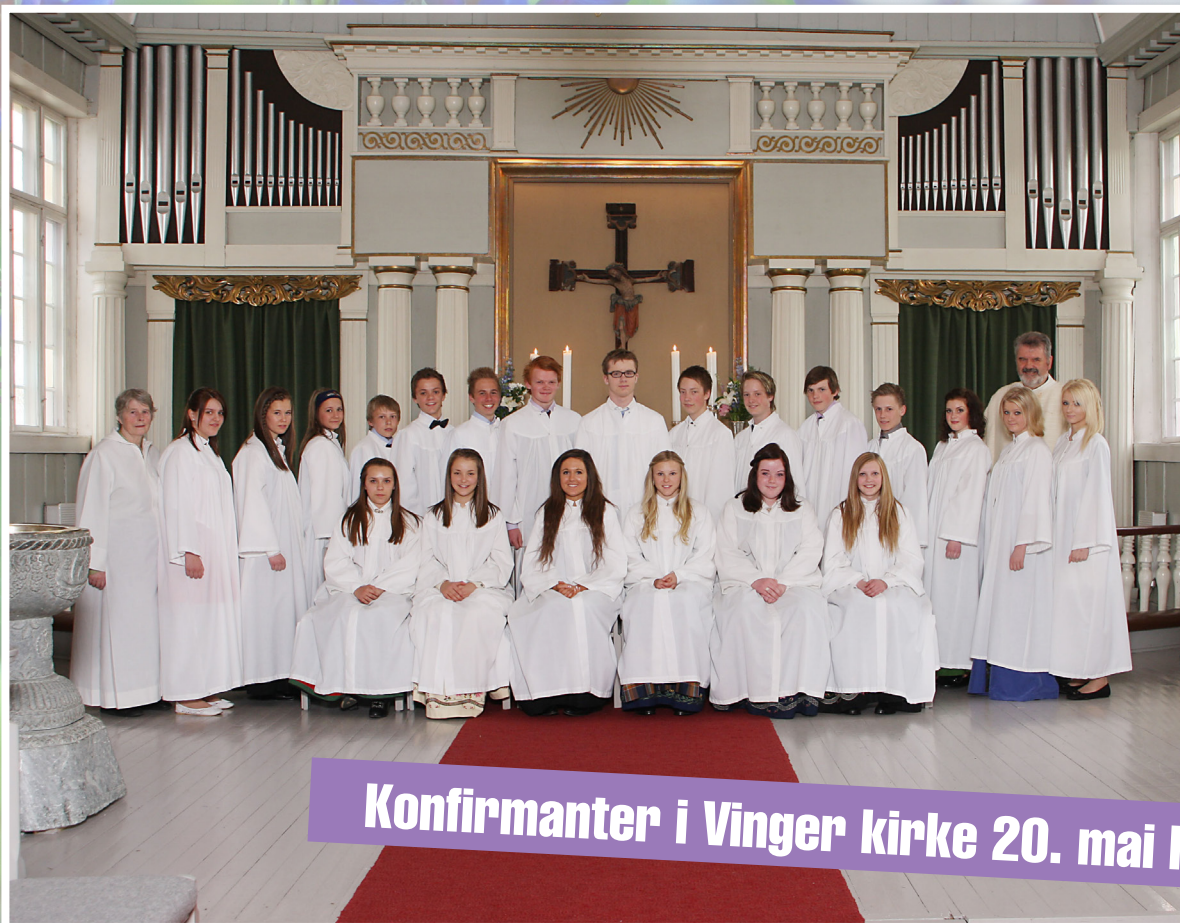
Konfirmanter i Vinger kirke 20. mai kl. 13.00