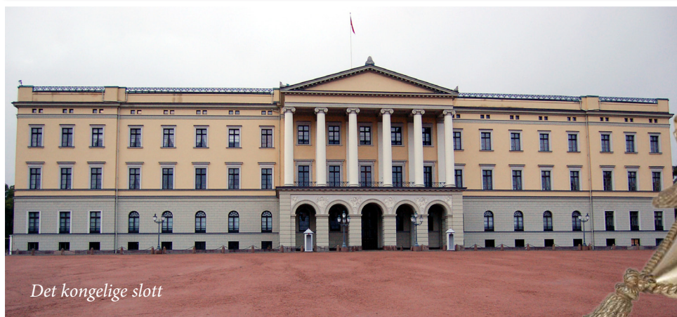
Det kongelige slott