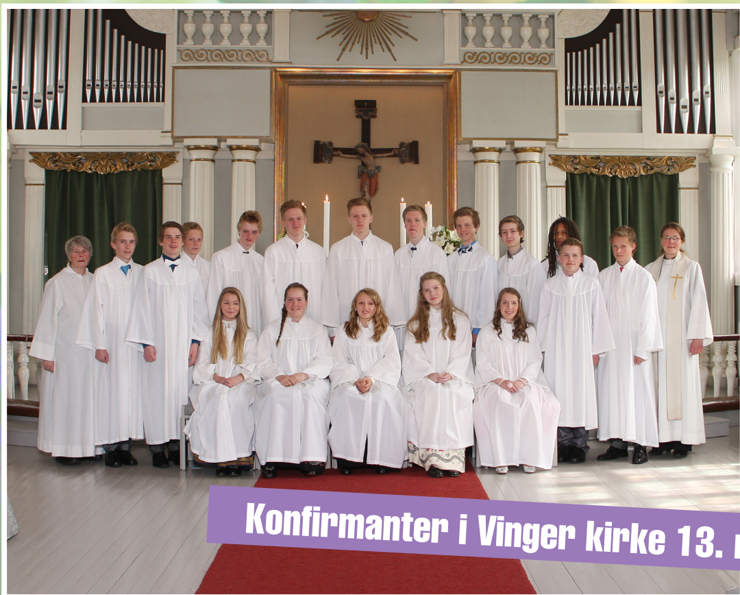
Konfirmanter i Vinger kirke 13. mai kl. 11.00