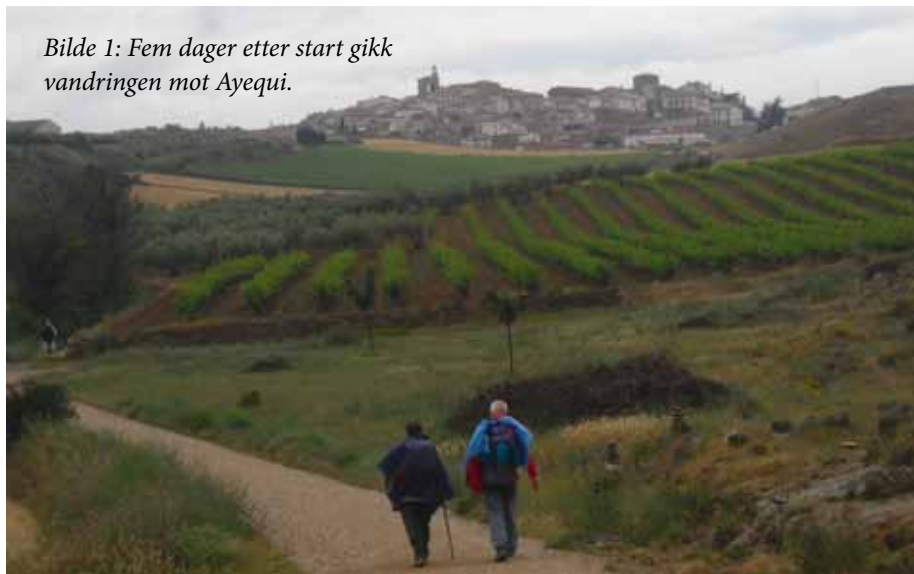
Bilde 1: Fem dager etter start gikk vandringen mot Ayequi.

mil. Det hørt helt latterlig ut å skulle gå så langt, og Santiago var bare et ord..... Vi startet vandringen kl 06.00 fra St. Jean Pied de Port i Frankrike en varm vårmorgen med 11 kg på ryggen. Spent la vi i vei gjennom den lille byen som så vidt begynte å våkne til liv, og etter hvert begynte stigningen oppover Pyreneene. Tåka og duskregnet kom, og etter hvert så vi bare konturene av hestene og kuene som gikk rundt oss. Det er en stigning på ca 1300 m, og vi gikk dessverre glipp av den fantastiske utsikten på grunn av tåken. Strekningen består av 2,5 mil med bratt stigning og ca 4 km bratt nedover til herberget. Beina skalv av trøtthet, og klærne var gjennomvåte da vi etter 10 timer skimtet den store murbygningen av et herberge, som i sin tid var et kloster. Her har de tatt imot pilegrimer i 700 år. Vi skreiv oss inn og måtte blant annet skrive litt om målet med turen og hvor vi kom fra. Deretter ble vi vist til en køyeseng i et firemannsavlukke i ett stort fellesrom. Vi delte med italienere som ikke kunne engelsk - men vi kommuniserte greit allikevel. Det hang en lukt av tigerbalsam i luften, mennesker fra alle nasjonaliteter satt og smurte og masserte ømme muskler. Én ting hadde vi alle felles, vi hadde mestret den harde førsteetappen over Pyreneene,