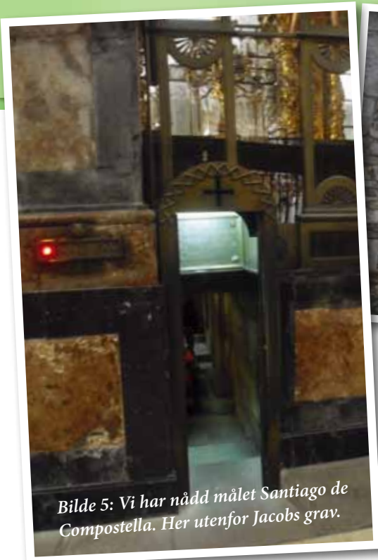
Bilde 5: Vi har nådd målet Santiago de Compostella. Her utenfor Jacobs grav.