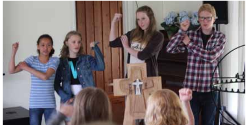
Når vi hadde samlinger, var det noen av de unge lederne og barna som var forsangere, og viste bevegelser til sangene.