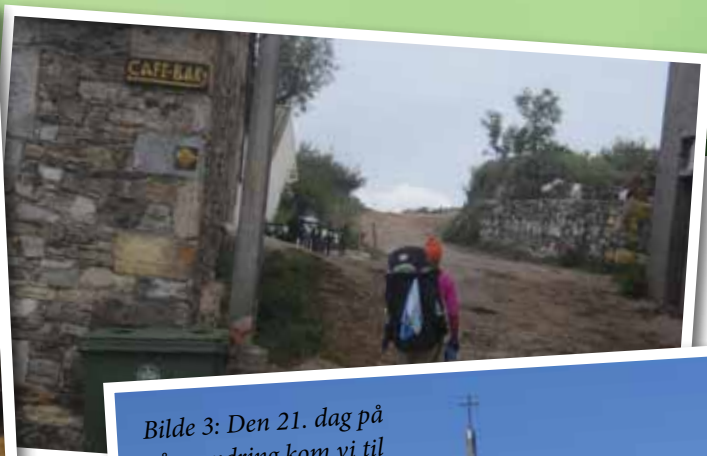
Bilde 4: Etter 24 dager nærmet vi oss Samos.