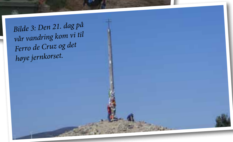
Bilde 3: Den 21. dag på vår vandring kom vi til Ferro de Cruz og det høye jernkorset.

kunne gi fritt rom for tankene. Hvor ofte har man tid til å mimre om barndommen hjemme? Man kunne sette seg ved et tre og filosofere. Hvor ofte her hjemme tar man seg tid til å redde en sommerfugl fra å drukne i en sølepytt? Man blir glad og takknemlig av skolebarn og eldre mennesker som jubler og roper: "Peregrino! Peregrino!" ("Pilegrim! Pilegrim!") etter oss. Det er en ubeskrivelig følelse når man ved femtida en morgen sniker seg ut av herberget for ikke å vekke noen, ut i frisk luft, på med hodelykten og finner de gule pilene som er malt på veier, trær og hus for å vise vei. Man går gjennom stille gater før stien fører forbi et hestebeite hvor hestene står og lur på hva slags gal kropp som kommer hastende bortover skogen. Videre innover en dyp skog, og etter halvannen time begynner det å lysne, man hører haner som galer og hunder som bjeffer i det fjerne. Sulten begynner å gnage, man nærmer seg en landsby. På en bakketopp får jeg utsikt over en bitteliten landsby med en kirke på det høyeste punktet, og kirkeklokken slår syv. Det er et øyeblikk å nyte og av de man aldri glemmer. Deretter finner jeg en åpen "bar", slår meg ned med et par pilegrimer fra Sør Afrika, kjøper en bocadillo med ost og skinke, juice og kaffe. Morgenen er perfekt, og det er fantastisk å leve!