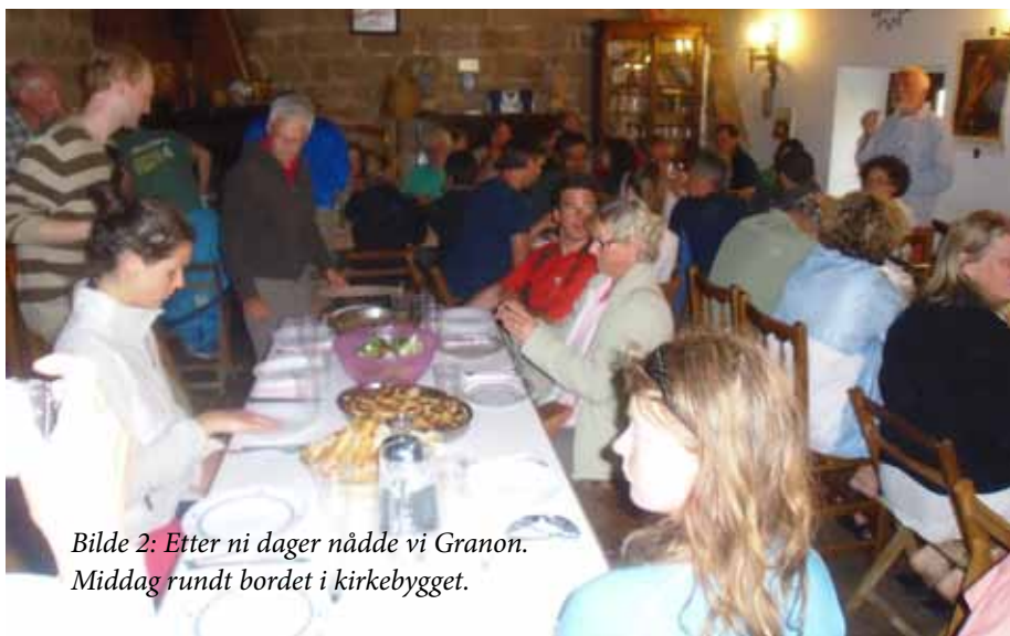
Bilde 2: Etter ni dager nådde vi Granon. Middag rundt bordet i kirkebygget.

Etter 9 dagers vandring kom vi til Granon hvor vi overnattet første gang på et kirkeleg herberge. Her ble vi møtt varmt med smil og en klem. Betalingen var donasjon - man gir etter evne for middag, overnatting og frokost. Det ble handlet inn av de pilegrimene fra dagen før hadde betalt og vi lagde middag sammen på kjøkkenet. Dette var en av de varmeste opplevelsene.