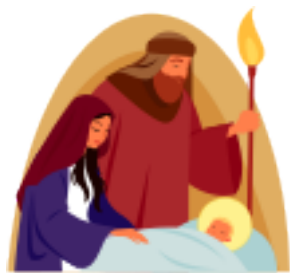
Wesoły Świąt Bożego Narodzenia