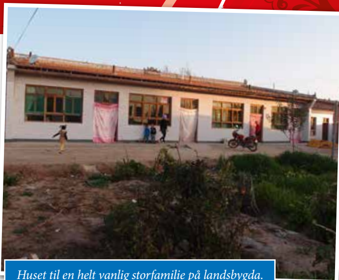
Huset til en helt vanlig storfamilie på landsbygda.

Vi visste ikke at de vi skulle besøke fikk sine første leker og bøker av oss (de eldste barna var 13 år). Vi visste ikke at når de skulle ut å handle til sin mor, som sårt trengte nye klær, måtte de velge mellom å kjøpe en genser eller en bukse. De måtte se videre etter en genser, fordi den de ville ha klarte de ikke å prute