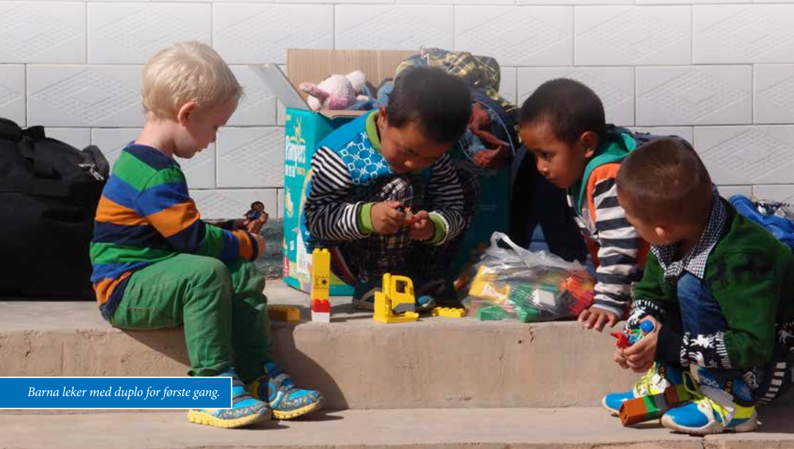
Barna leker med duplo for første gang.

Vi kan gi penger. Det vil gjøre at de får et godt liv her og nå, og det er selvfølgelig viktig. Men vi ønsker å gi mer enn det. Vi ønsker å gi dem muligheten for et godt liv i evigheten. Men hvordan kan de velge å følge Jesus, når de aldri har hørt om ham?