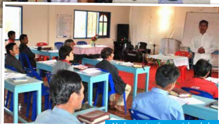
Undervisning for menighetsledere.

Vårt bidrag har gjort at kirken i Laos nå kan drive mer åpent og kan forkynne evangeliet forholdsvis fritt. Vi besøkte en bibelskole i byen Pakse. Der fikk menighetsledere komme og få videre utdanning i kristendomskunnskap. Dette skjer i full