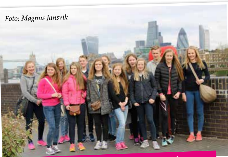
Vingerkonfirmantene samlet til gruppebilde foran Themsen.