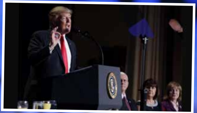
President Donald Trump talte.