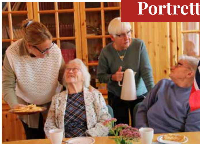
Det blir servert vaffelhjerter i kirken på Roverud på torsdager.

– Min jobb er å gå sammen med dem en bit av veien de går i