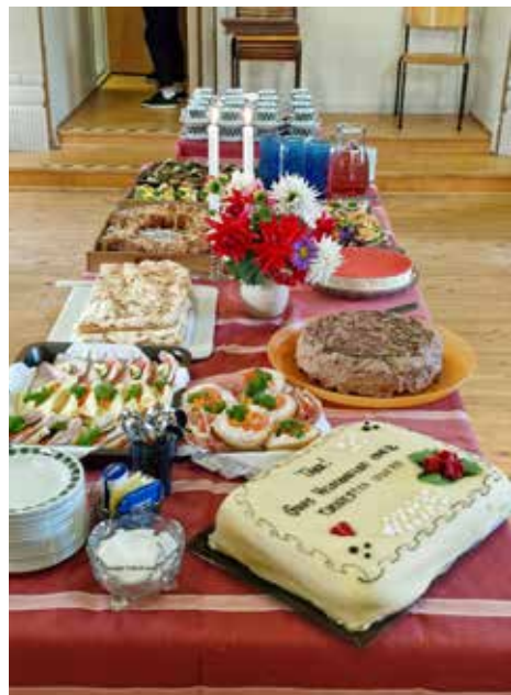
Høsttakkefest ved Brandval Bygdekvinnelag.